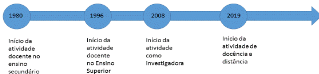
Figura 3 – Fluxograma da tipologia de atividade docente.

Há mais de quarenta anos que a minha profissão é a docência. Mesmo durante os anos que trabalhei exclusivamente na carreira de investigação, foi a docência que modelou e modela a minha identidade profissional. Do fluxograma acima, marcado pelos respetivos re-inícios de carreira, não pode, nem deve inferir-se que cada início implica deixar de se ser o que se foi antes... À maneira dos processos piagetianos de acomodação e equilíbrio, cada início é-o de um estágio mais abrangente.