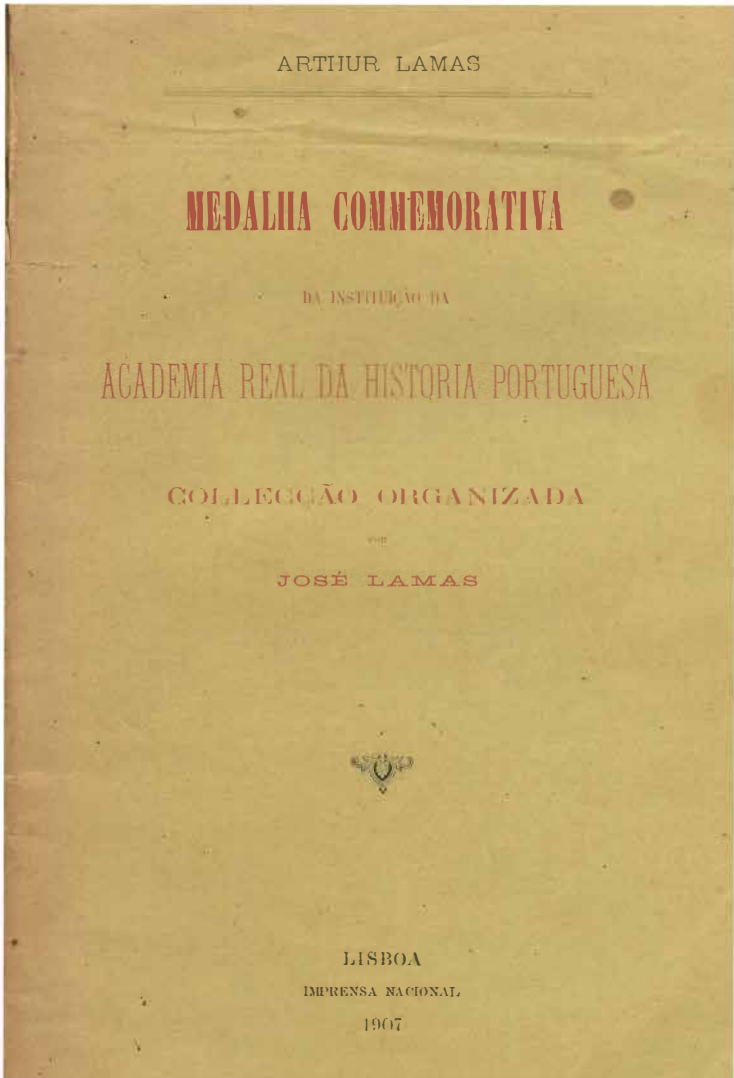
Fig. 7 – Capa da separata do estudo dedicado por Artur Lamas à medalha comemorativa da fundação da Academia, publicado em 1907. Exemplar e foto do autor.

Adianta este autor que Vieira Lusitano, artista que era muito próximo do Director da Academia, o Marquês de Abrantes, de quem terá partido a iniciativa de executar a medalha em apreço,