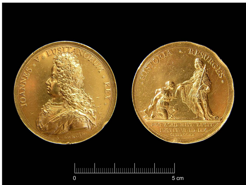
Fig. 6 – Exemplar da medalha de ouro comemorativa da fundação da Academia. Palácio Nacional de Mafra