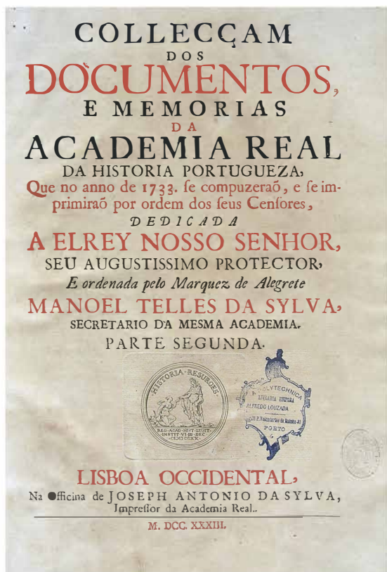
Fig. 3 – Folha de rosto do volume da Colecção dos Documentos e Memórias da Academia Real da História Portuguesa impresso em 1733 contendo a vinheta representada no reverso da medalha comemorativa da fundação da Academia. Foto do autor do exemplar da Biblioteca da APH.

que o retrato de hum Emperador dos Romanos (...)" (Biblioteca Nacional, ms. n.º 685, fl. 119 e seg.) 1 (Fig. 4).