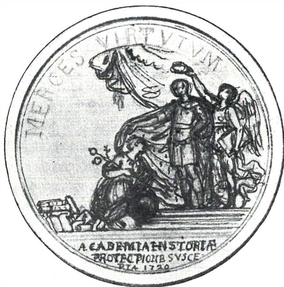
Fig. 8 – Desenho a sanguínea existente na Biblioteca de Évora, da autoria de Vieira Lusitano, correspondente a estudo para o reverso da medalha comemorativa da fundação da Academia (LAMAS, 1907, Fig. 4).

se inspirou em numisma da época de Vespasiano, tendo presente as semelhanças entre esta e um desenho a sanguínea existente na Biblioteca de Évora, no qual o Rei, de pé, estende a mão sobre a cabeça da História que na sua frente se encontra ajoelhada, correspondendo um primeiro ensaio do modelo que depois foi adoptado (Fig. 8). A ideia de adaptação de um numisma romano terá, assim, partido do próprio Marquês de Abrantes, pioneiro dos