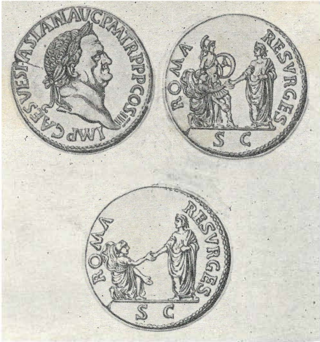
Fig. 4 – Reprodução de numisma de Vespasiano (9-79 d.C.) (LAMAS 1907, Fig. 2 e Fig. 3), em cujo reverso se inspirou (eliminando a segunda figura a contar da esquerda) a iconografia da medalha.

Depois do Rei distribuíram-se outros exemplares, de ouro e de prata, pela Família Real, pelos Académicos e pelos membros da Corte.