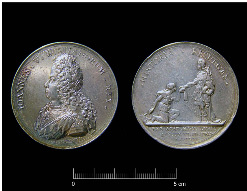
Fig. 5 – Exemplar da medalha de prata comemorativa da fundação da Academia.