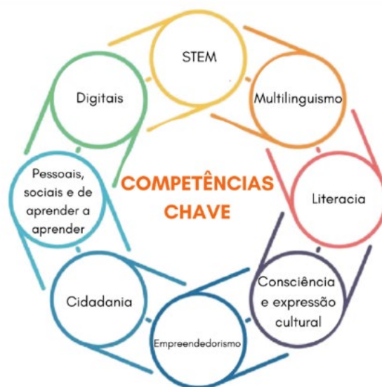
Figura 1: Quadro de competências-chave para a aprendizagem ao longo da vida. Adaptado Comissão Europeia (2019).

Neste contexto as Instituições de Ensino Superior têm uma responsabilidade acrescida, pois pela sua missão na área da educação, da investigação e da inovação, devem fomentar a fluência digital dos seus professores. No entanto, evidências empíricas mostram que muitos professores têm dificuldades em integrar a tecnologia nas suas práticas e, estas acabam por ser frequentemente usadas para apoiar práticas tradicionais que pouco acrescentam ao processo de ensino-aprendizagem (Crompton; Sykora, 2021). Em 2018, um estudo da OCDE revelou que, em média, menos de 40 % dos educadores em toda a União Europeia se sentiam à vontade para utilizar tecnologias digitais no ensino.