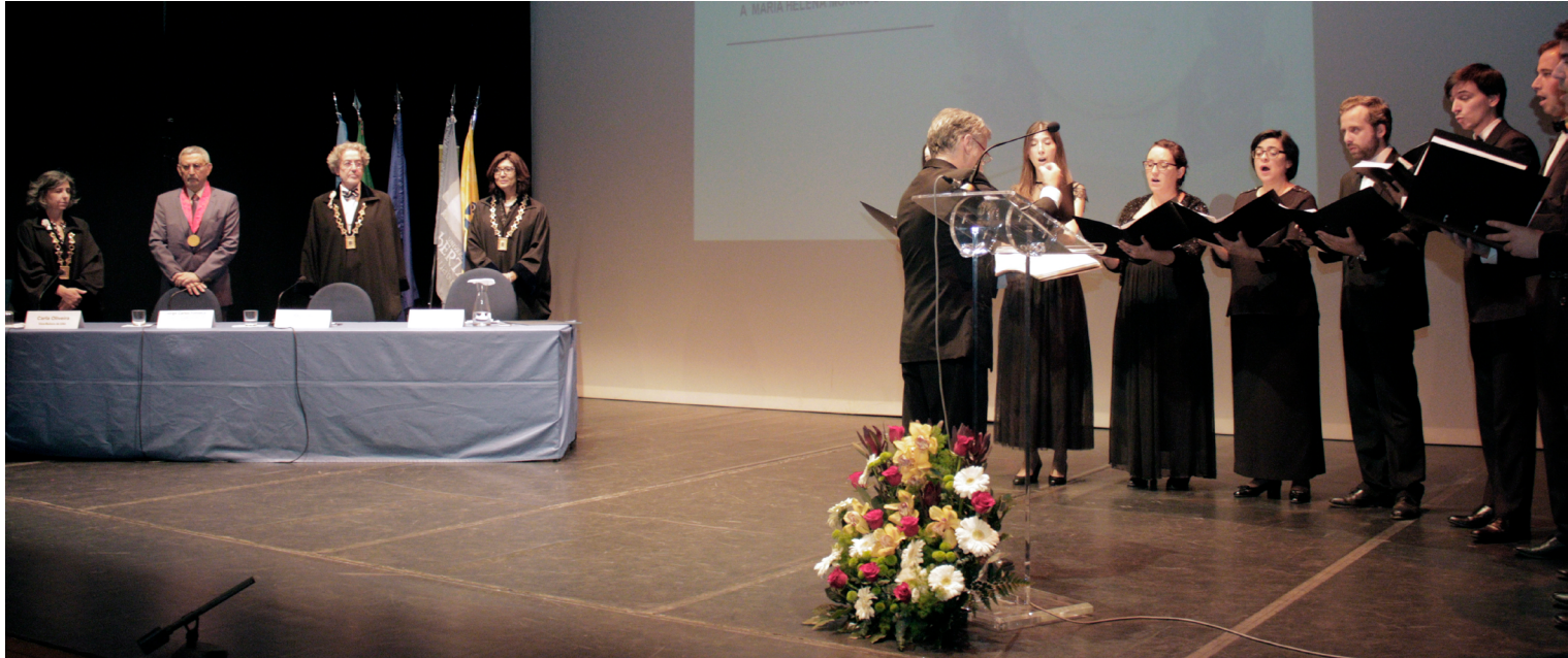
Coro Lisboa Cantat