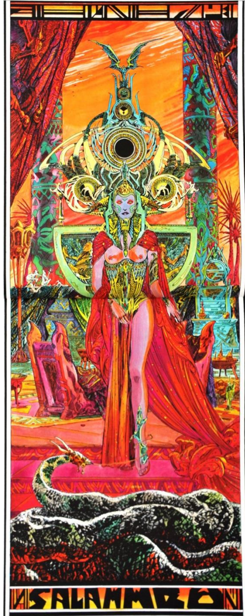
Philippe Druillet, Salammbô (1981).