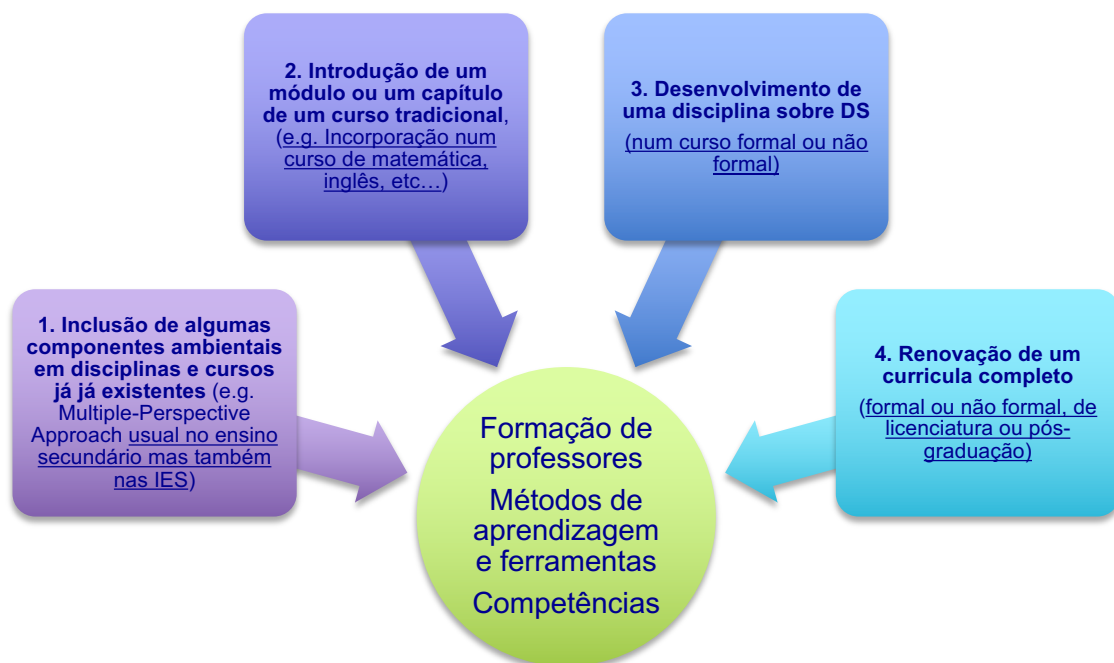
Figura 2 - Principais tipos e abordagens de aplicação da EDS nos currícula.