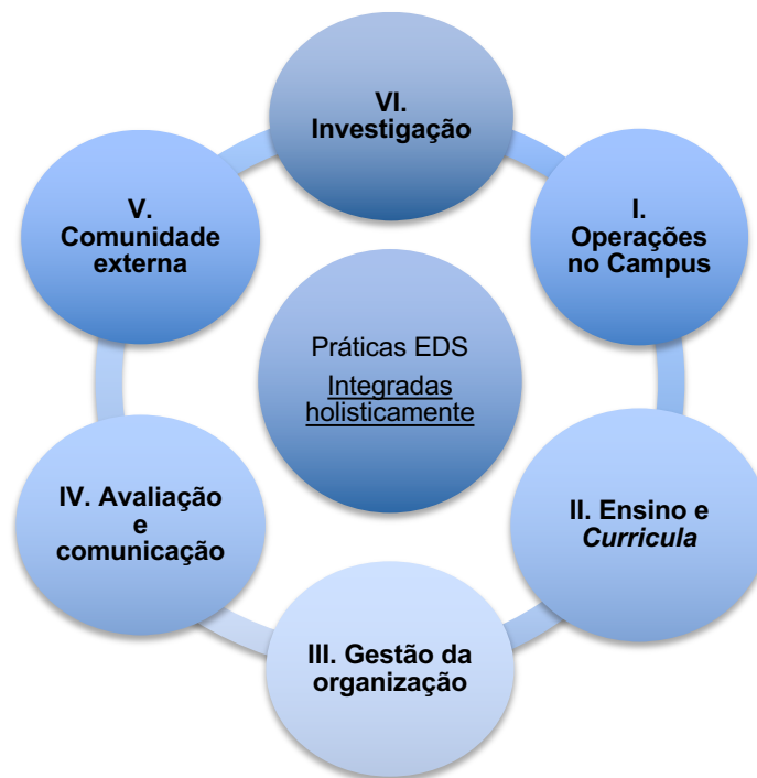
Figura 1 – Tipos de práticas de implementação da Educação para o Desenvolvimento Sustentável (com base em Lozano et al. , 2015b e UNESCO, 2012b).

Nos próximos subcapítulos ilustra-se o que se entende por cada um dos eixos com os respetivos exemplos de implementação.