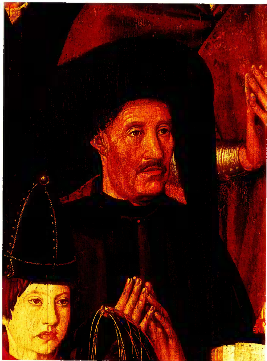
Painéis de São Vicente de Fora, atribuídos a Nuno Gonçalves. Pormenor do Painel do Infante. Museu Nacional de Arte Antiga, Lisboa.