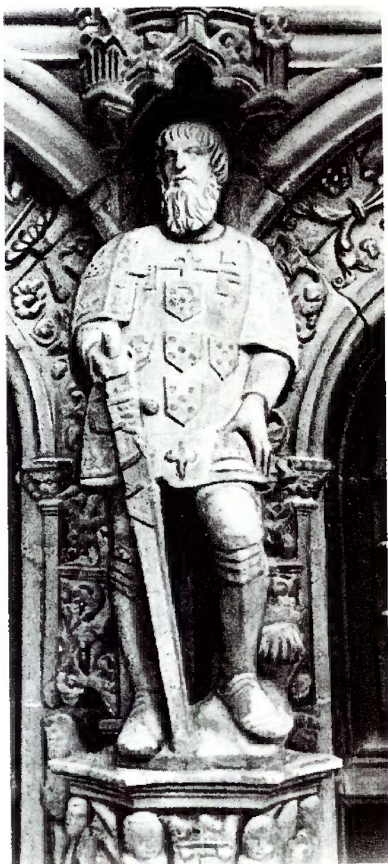
Estátua evocativa do Infante D. Henrique, no portal sul da igreja do Mosteiro dos Jerónimos.