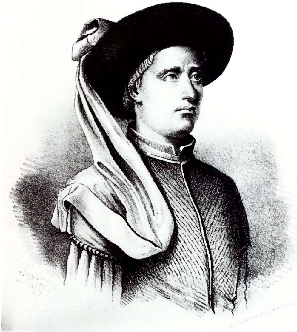
Litografia do Infante D. Henrique de C. Legrand, in Universo Pittoresco . Lisboa, 1843-44.