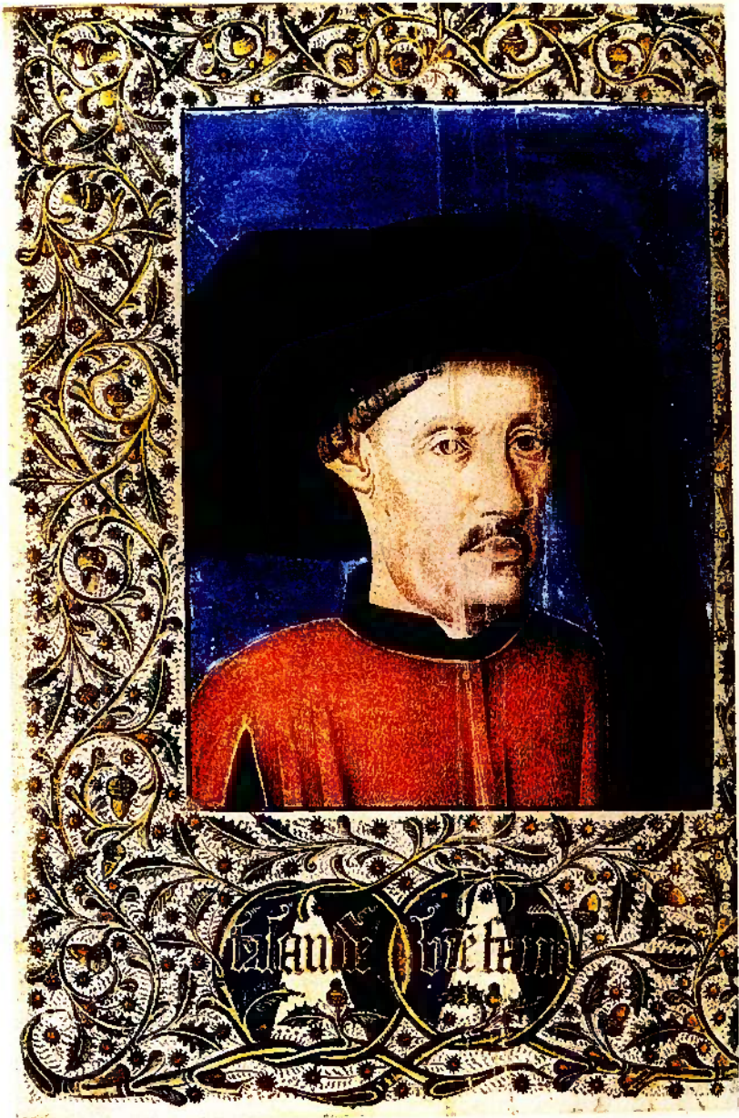
Illuminura da Crónica dos Feitos de Guiné , de Gomes Eanes de Zurara. Manuscrito da Biblioteca Nacional de Paris.