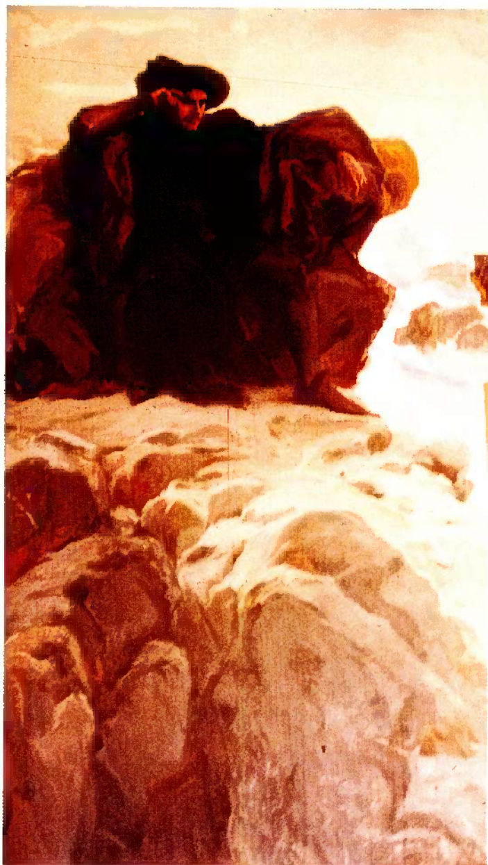
Pintura a óleo de José Malhoa, intitulada O Sonho do Infante , de 1905. Museu Militar, em Lisboa.