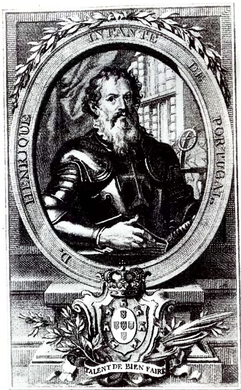
Gravura a buril de Joaquim Carneiro da Silva, Da Ásia de João de Barros e de Diogo de Couto, Nova Edição oferecida a sua Magestade D. Maria I Rainha Fidelíssima, Lisboa, Na Regia Officina Typografica, 1778.