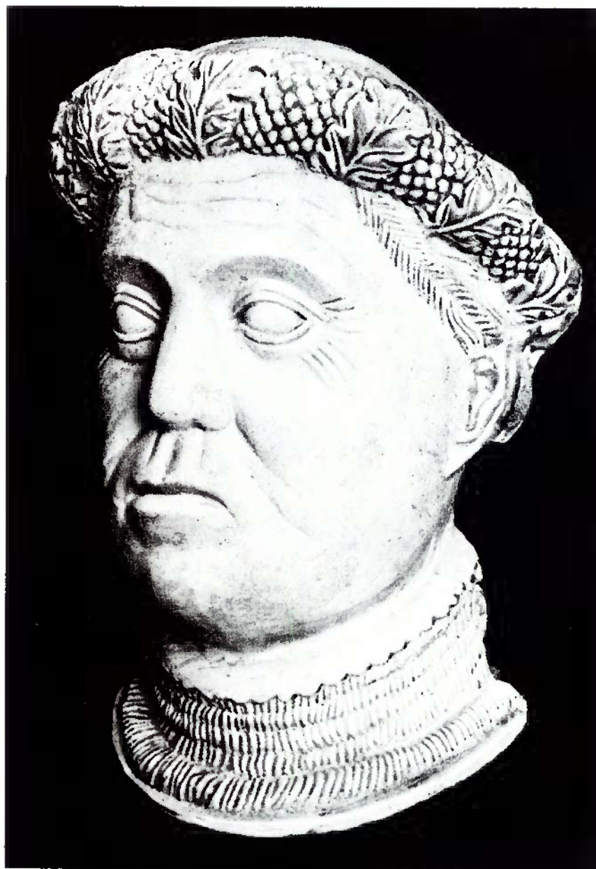
Cabeça do Infante D. Henrique. Pormenor da estátua sepulcral da Batalha.