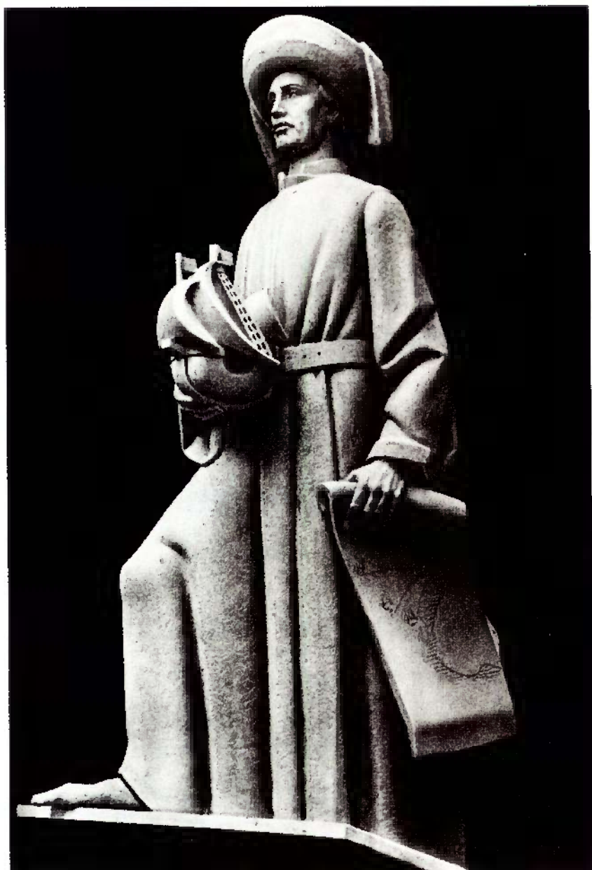
Escultura de Leopoldo Neves de Almeida, executada para o Padrão dos Descobrimentos que foi inaugurado nas comemorações henriquinas de 1960 (1.ª versão, em gesso, para a Exposição do Mundo Português, em 1940).