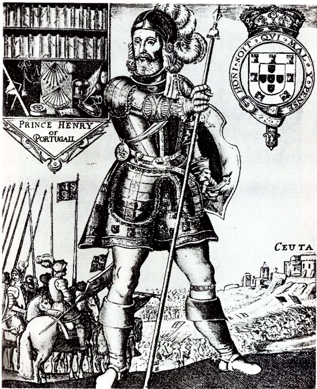
Gravura a buril atribuída a Thomas Cecill – Thomas Cross, in Luís de Camoens, The Lusiad, or Portugals, Historical Poem , now newly put into english by the Right Honourable Sir Richard Fanshaw, London, 1655.