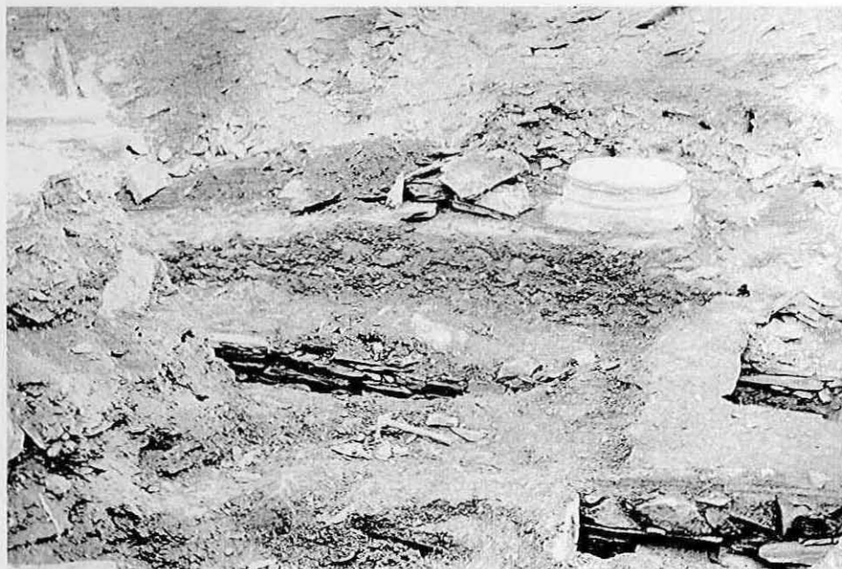
Fig. 3 – Vista parcial das escavações de 1908 do Rossio do Carmo, em Mértola, observando-se a divisória entre a nave central e uma das naves laterais da basílica, correspondente a muro onde assentam duas colunas (ver Fig. 1).