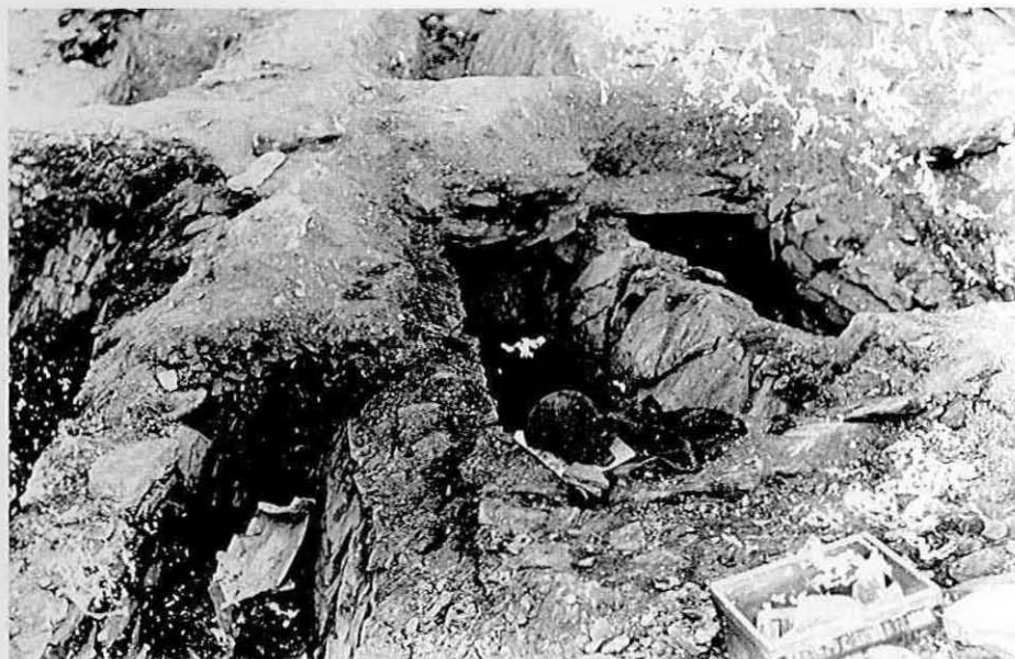
Fig. 7 - Vista parcial das escavações de 1908 do Rossio do Carmo, em Mértola, observando-se diversas sepulturas, uma das quais contendo restos humanos em bom estado de conservação.