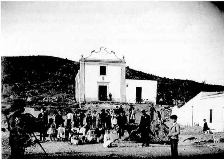
Fig. 2 – Vista geral do Rossio do Carmo, em Mértola, local das escavações realizadas em 1908.