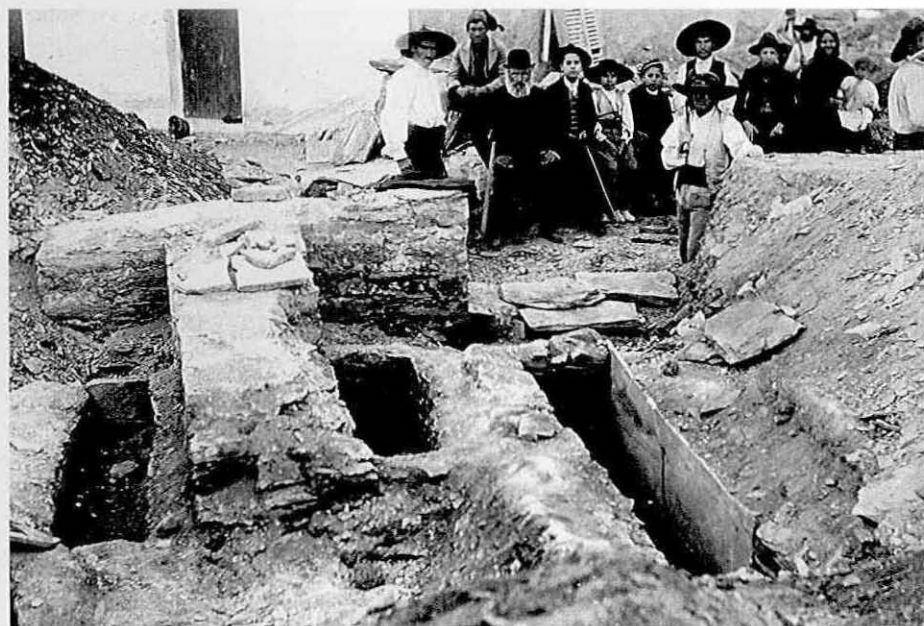
Fig. 4 – Vista parcial das escavações de 1908 do Rossio do Carmo, em Mértola, observando-se diversas sepulturas, de um e outro lado da divisória entre a nave central da basílica e uma das naves laterais, com remate em "T". Os numerosos populares, em segundo plano, dispõem-se ao longo do arranque de uma das absides da basílica, também então posta a descoberto (ver Fig. 1).