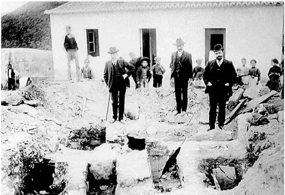
Fig. 6 - Vista parcial das escavações de 1908 do Rossio do Carmo, em Mértola, observando-se diversas sepulturas. À direita, encontra-se J. Leite de Vasconcellos. Foto Arquivo MNA, reproduzida por B. Ferreira.