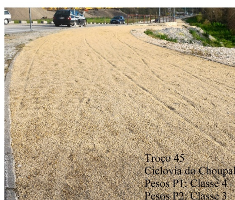
Fig. 2 Exemplos de arcos levantados

Por fim, note-se que a utilização de dois conjuntos de pesos poderá ajudar a uma melhor organização e planeamento das intervenções a realizar: p.ex. arcos que tenham más classificações em ambos os conjuntos de pesos são candidatos naturais a intervenções prioritárias.