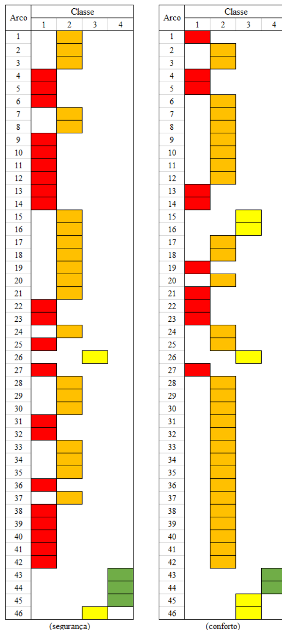
Fig. 1 Resultados para o estudo de caso (Classe 1: pior; Classe 4: melhor)

No Figura 2 abaixo são apresentados, a título de exemplo, quatro arcos e respetiva classificação.