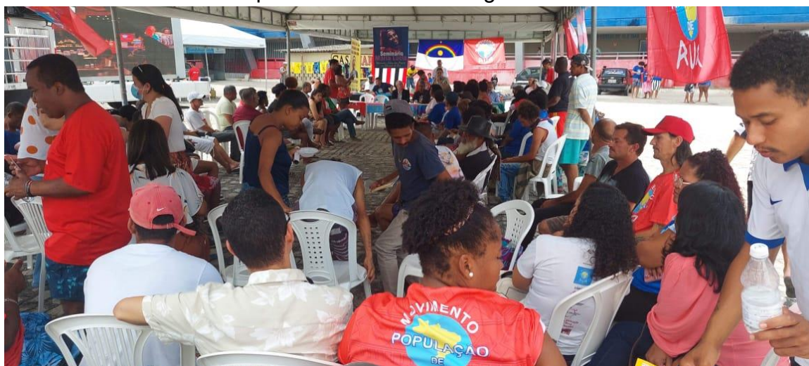
Data: 22/09/2023. Estádio Rei Pelé. Maceió.

Oficina “A luta do MNPR por Moradia” do V Congresso Nacional do MNPR