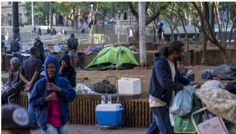
População de rua na praça da Sé, no centro de São Paulo; órgãos públicos não souberam informar os números de pessoas em situação de vulnerabilidade que morreram na região entre 2021 e o começo deste ano Imagem: 18.mai.2022 - André Porto/UOL