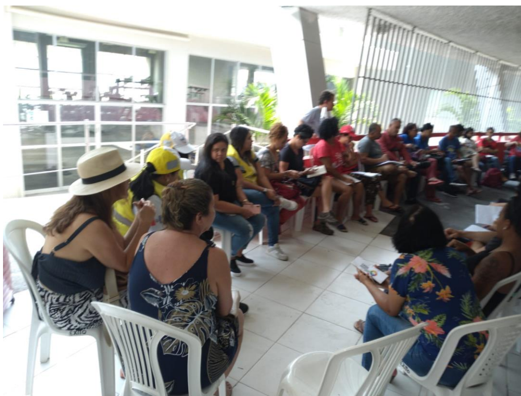
23/09/2023. Estádio Rei Pelé. Maceió.

Reunião dos apoiadores e militantes no V Congresso Nacional do MNPR