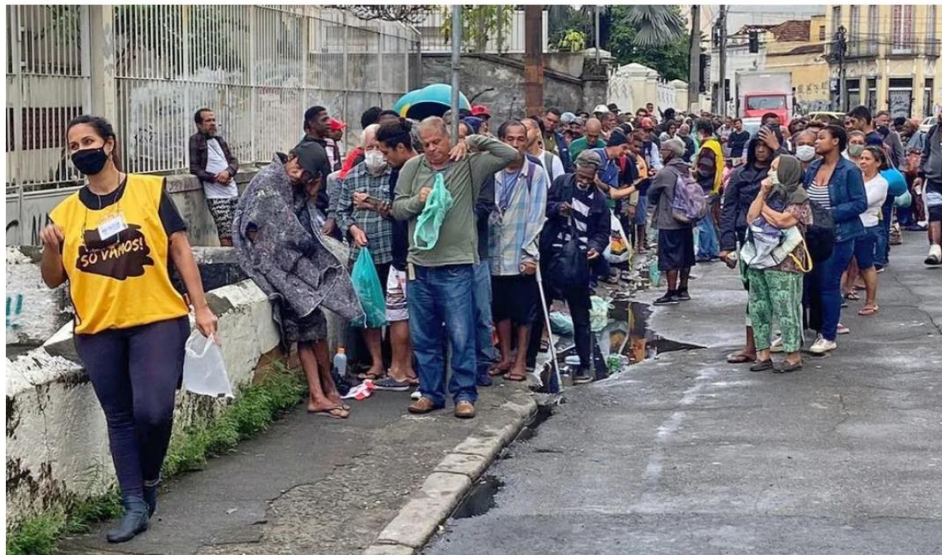
Ação de distribuição de quentinhas do Só Vamos — Foto: Reprodução