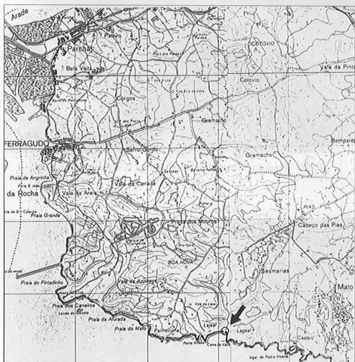
FIG. 1 – Localização da Presa dos Mouros (Lagoa)