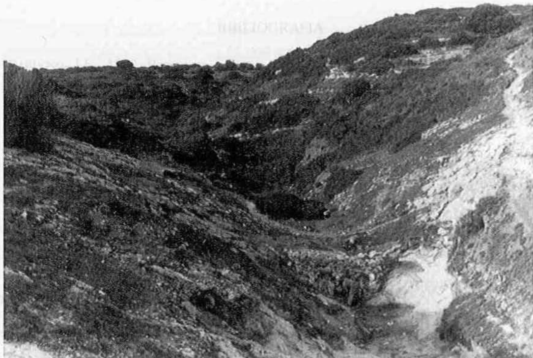
FIG. 2 – Presa dos Mouros. Vista de Sul