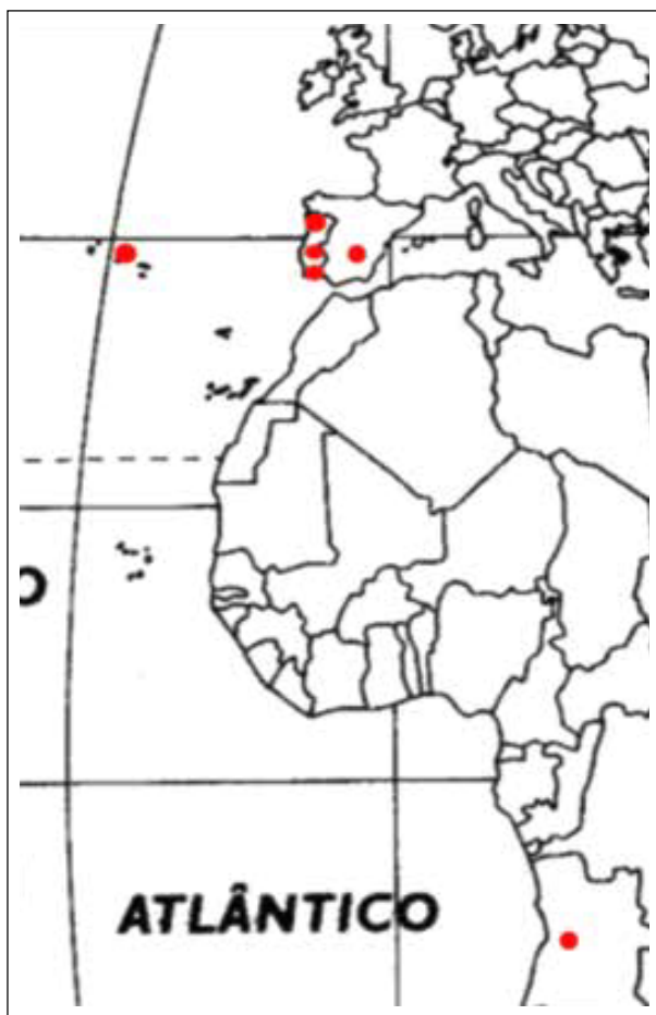
Figura 1. Estudantes da UC Seminário de Investigação 2016/2017 – dispersão geográfica

Os docentes têm uma intervenção a montante deste encontro com os estudantes. O desenho pedagógico do percurso do Seminário de Investigação. Ao longo do semestre o seu papel é desempenhado no acompanhamento e motivação, em interação com os estudantes, em fórum, em chat (colibri) ou por e-mail. A componente de avaliação é efetuada em cada tarefa, com um comentário geral sobre o tema e os resultados obtidos e um comentário individual ao trabalho desenvolvido por cada um dos estudantes. Na fase final do semestre é efetuada a avaliação do trabalho final.