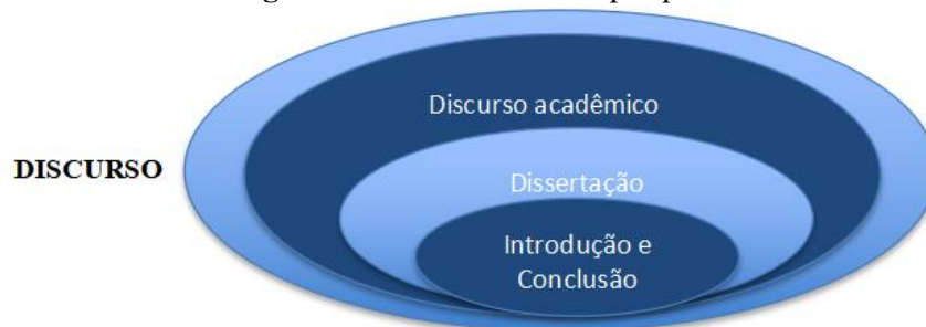
Figura 1 - Foco temático da pesquisa

Na prossecução dos objetivos desta pesquisa, circunscrevemos nossa análise a dissertações de mestrado, especificamente aos gêneros incluídos “Introdução” e “Conclusão”, resultando em uma análise focada de acordo com o esquema abaixo: