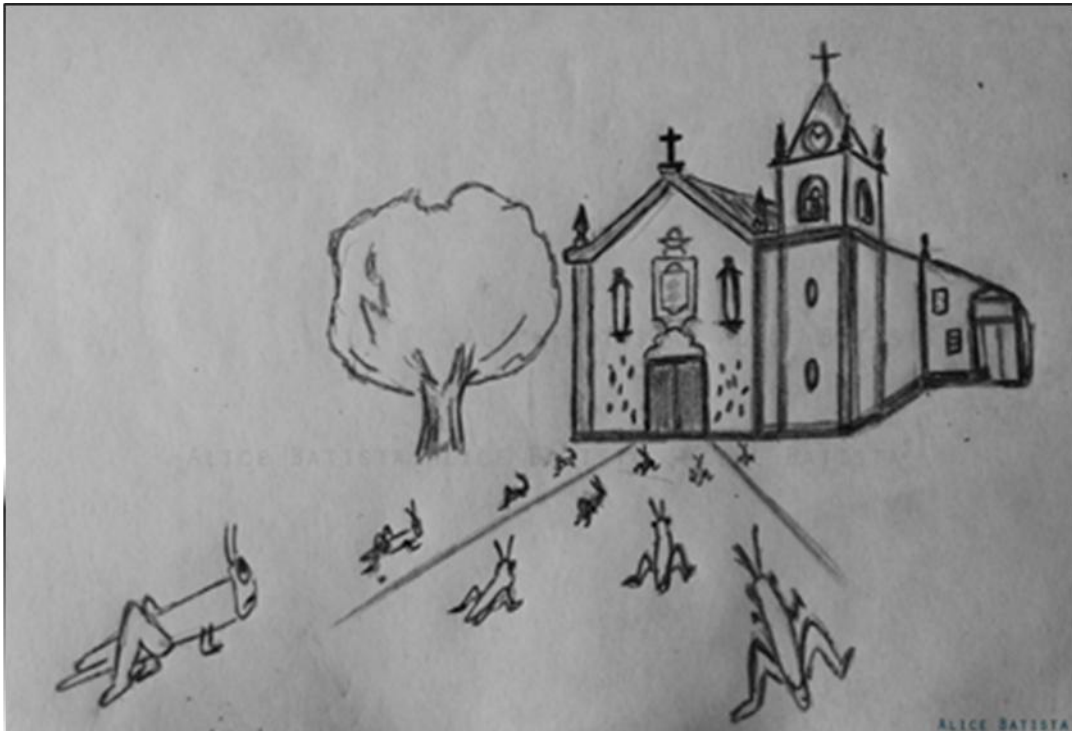
Figura 7: A Lenda do Gafanhotos

Reza a história, que na aldeia de Lousa, nos Escalos de Cima, Escalos de Baixo e também em Alcains e Lardosa, aconteceu no ano de 1640, (folheto da Junta de Freguesia da Lousa) uma praga de gafanhotos causadora de enorme devastação económica nas referidas aldeias, sendo a agricultura o seu único sustento. O prejuízo previa-se tal, que a população pediu a intervenção divina, aos seus Santos Protetores. A Lousa não foi exceção e uniu todas as suas forças e em unísono rogaram à virgem dos Altos céus que os protegesse de tal calamidade. Em troca deixaram a promessa que todos os anos vindouros cumpririam religiosamente uma retribuição em troca do favor solicitado. Essa retribuição e/ou agradecimento contaria de uma festa em homenagem à virgem. Parece, ao que consta, que as preces do povo foram imediatamente ouvidas e atendidas, pelo que até hoje, geração após geração os Lousences têm cumprido, fielmente, a referida promessa, numa festa de grande aparato litúrgico e pagã que