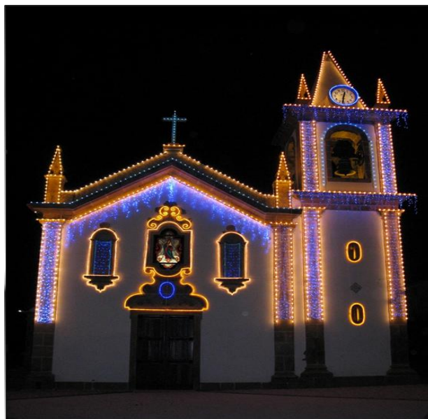
Figura 6: Festas e Romarias