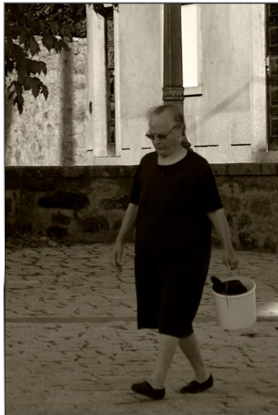
Figura 3: As suas gentes