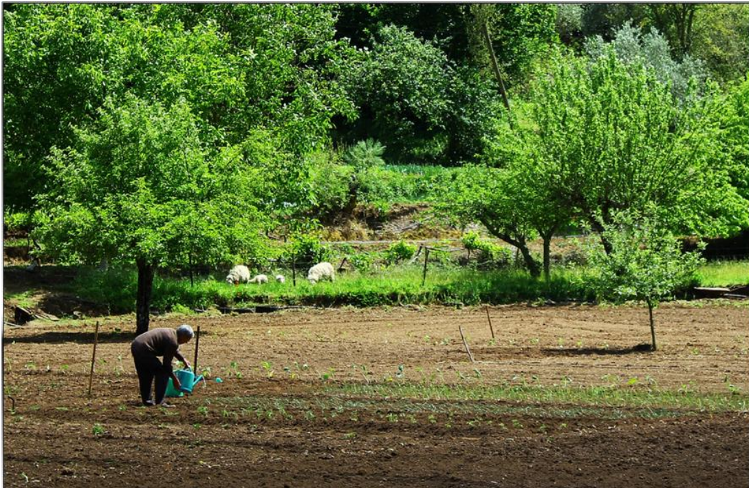
Figura 4: Modo de vida – agricultura de subsistência

A casa Agrícola Vaz Preto, a casa Goulão e a Casa Abrunhosa foram entidades empregadoras por excelência. Outra actividade com bastante relevo foram os moleiros, cujo desempenho foi bastante significativo para o desenvolvimento da economia local. Foi de conhecimento público recente, a existência de duas profissões bastante singulares na Lousa e que surgem referenciadas num Anuário de 1934 oferecido por Eduardo Nunes onde vem referido a existência de um “ armador d’igrejas ” e de duas “ estalagens ” ( http://rabiscoslousenses.blogspot.com/2009/07/lousa-em-1934.html ). Devido ao factor desertificação, mais uma vez se constata que a agricultura em grande escala deu lugar, na actualidade, à agricultura de subsistência.