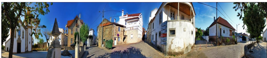
Figura 2: Panorâmica das 3 ruas principais que constituem a aldeia da Lousa

aromáticas como o rosmaninho compõem o quadro bucólico da paisagem que a representa. Por esses campos habitam coelhos lebres e perdizes que estão hoje em vias de extinção. Muitas casas de granito antigo têm sido substituídas por outras de cimento e betão por influência da evolução do tempo e pela procura de conforto cada vez mais significativa. No entanto por aqui e por ali, espalhadas pela aldeia as construções mais antigas ainda sobrevivem à influencia dos tempos modernos e teimam em manter-se hirtas, denunciando a marca dos tempo passados. Por aqui e por ali em algumas habitações e fontanários surgem traços quinhentistas, como principais marcas de uma antiguidade longínqua de gente que deixou a sua existência profundamente enraizada na aldeia e nos seus habitantes.