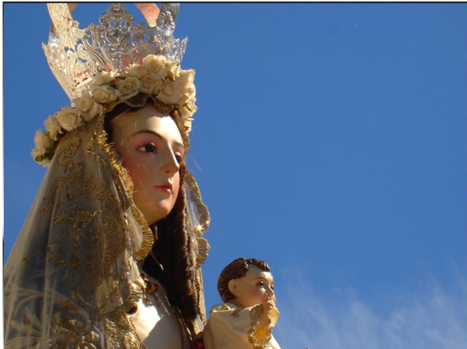
Figura 5: Nossa Senhora dos Altos Céus