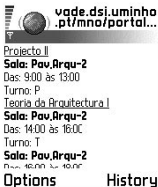
Figura 5 – Resultado de uma pesquisa do horário diário de determinado curso

O horário semanal de determinada disciplina apresenta um comportamento idêntico ao descrito para o método anterior. A diferença essencial reside no tipo de resultado obtido, pois neste caso será apresentada a informação horária semanal de uma determinada disciplina, dados o curso, ano e o semestre, conforme resultado apresentado na Figura 6.