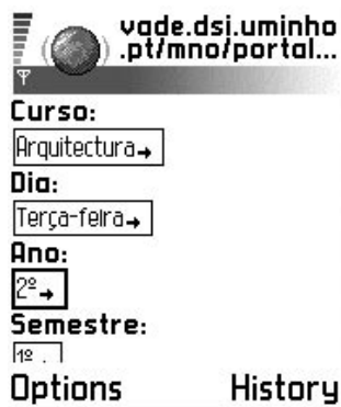
Figura 4 – Horário diário de determinado curso

A obtenção de informação relativa aos horários, pode ser conseguida através de dois métodos distintos: horário diário de determinado curso e horário semanal de determinada disciplina.