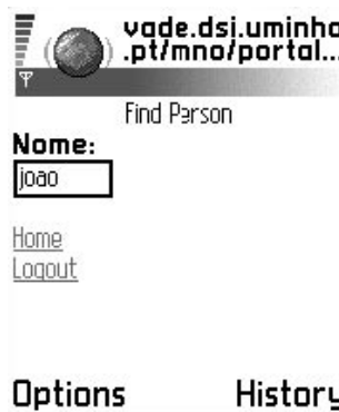
Figura 2 – Parametrização da funcionalidade

A integração desta funcionalidade na aplicação baseia-se em duas abordagens distintas: global, em que os resultados obtidos referem-se a todo o ambiente (não dependem da localização); restrita, em que os resultados obtidos dependem directamente da localização do utilizador.