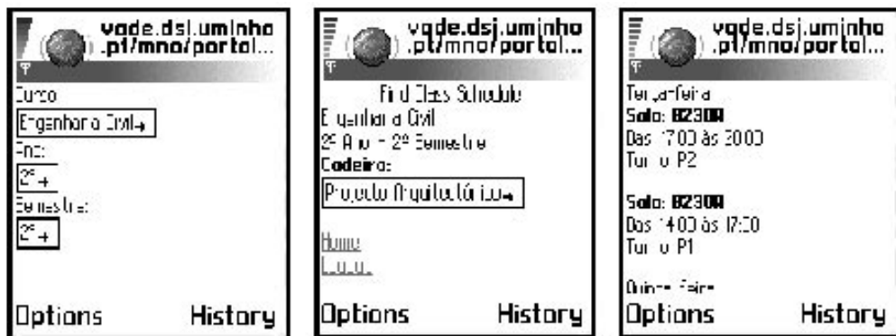
Figura 6 – Obtenção do resultado de uma pesquisa do horário semanal de determinada disciplina

Contudo, a opção mais natural será a pesquisa de eventos não dependente da localização do utilizador.