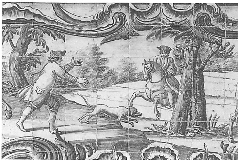
FIGURA 5 - Painel azulejar com figuração sobre a caça, Palácio Rebelo de Andrade-Ceia em Lisboa, actual sede da Universidade Aberta