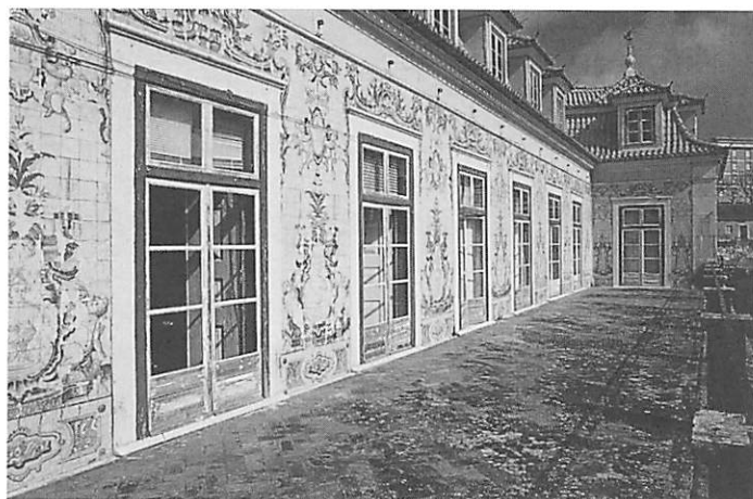
FIGURA 4 - Revestimento azulejar da varanda sul do Palácio Marquês de Pombal em Oeiras