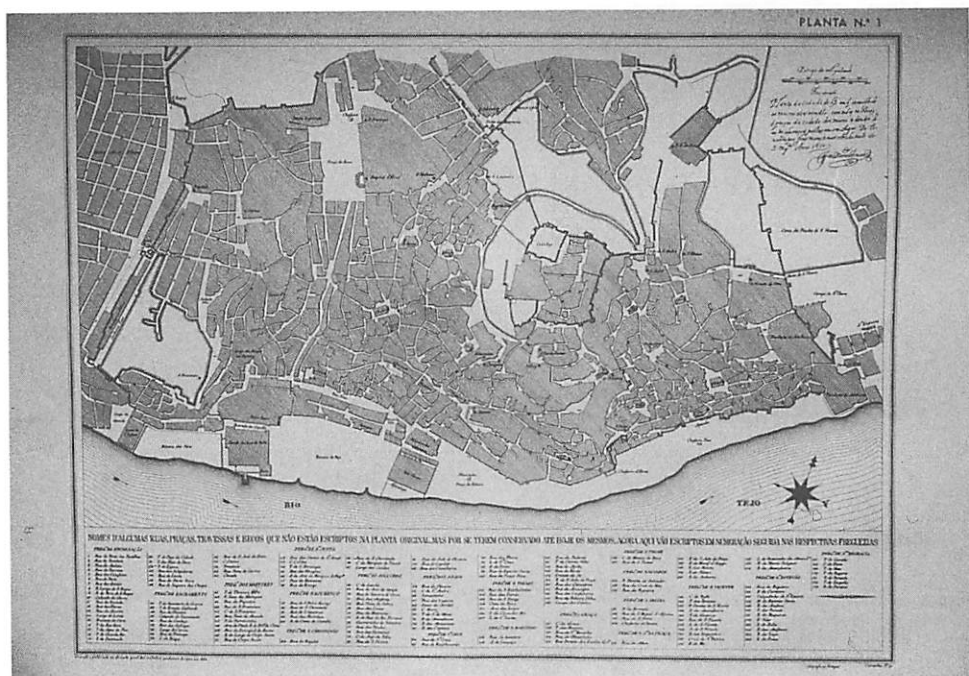
FIGURA 1 - Planta da cidade de Lisboa desenhada por João Nunes Tinoco (1610)