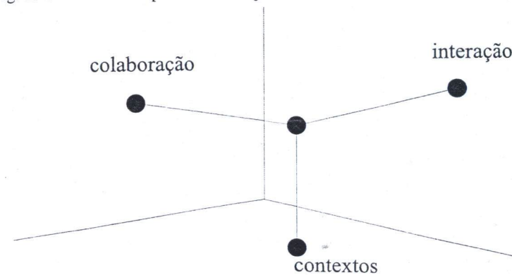
Fig. 2. Uma interface para a construção do conhecimento

Esta interface é um meio para construir coisas com significado, ligando as aprendizagens aos contextos e aos lugares do conhecimento promovendo, deste modo, a aproximação entre os espaços da aprendizagem e os da sua aplicação (Fischer, 2000). É, assim, um instrumento de modelação cognitiva das redes de representação de conhecimento e um meio para o desenvolvimento das socializações dos membros das comunidades no espaço do virtual. E ganha uma nova importância na medida em que o seu papel é cada vez mais importante na transferência do conhecimento para os espaços profissionais, flexibilizando as ligações entre o espaço e o tempo das aprendizagens, em ordem ao desenvolvimento das redes colaborativas de partilha e inovação.