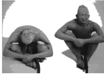
Imperdurable mente presente, infláveis, 2002

Duas de suas obras mais recentes “Entre irse o quedarse”, composição que trata das migrações, e a surpreendente série “El imperdurable mente presente”, composta por quatorze esculturas humanas infláveis que se inflam e desinflam a cada trinta segundos retomam alguns de seus temas permanentes. As figuras infláveis feitas de borracha e postas em movimento por um mecanismo elétrico encenam o ato primeiro da criação quando o sopro divino deu vida ao barro. Apesar de serem de borracha, a textura destas inusitadas esculturas recria a ilusão daquela matéria. Esta obra, inserida na tradição cultural mexicana, retoma outro ato de criação do também mexicano o poeta Octavio Paz que intitulou como “filhos do barro” um de seus livros mais importantes, no qual, seguindo a tradição sociológica latino-americana, a qual também se filia Antonio Candido, pensa a construção da nossa identidade somente dentro do marco da construção da nacionalidade situada entre os séculos XIX e XX. Representando figuras com o fenótipo indígena, Martínez coloca em destaque aos indígenas e ao instante originário encenado na alegoria das imagens que adquirem vida, tornam a sucumbir e como os movimentos Zapatistas, tornam a erguer-se.