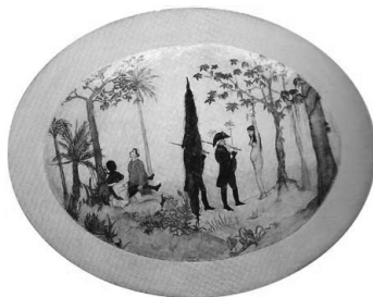
Filho Bastardo | 1992 (óleo sobre madeira)