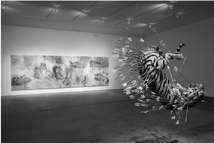
Inopportune: Stage Two (vista parcial da instalação)

É possível comparar o tigre-em-devir chinês de Cai com a onça-em-devir brasileiro de Guimarães Rosa (cf. ALMEIDA, 2002), ambos escritor e artista compatibilizam os elementos da tradição de suas culturas com a representação de uma animalidade em conflito com a ordem coronelesca no caso de Rosa e da harmonia imposta sobre uma repressão do corpo, como ocorre na cultura chinesa e recriada por Cai Guo-Giang.