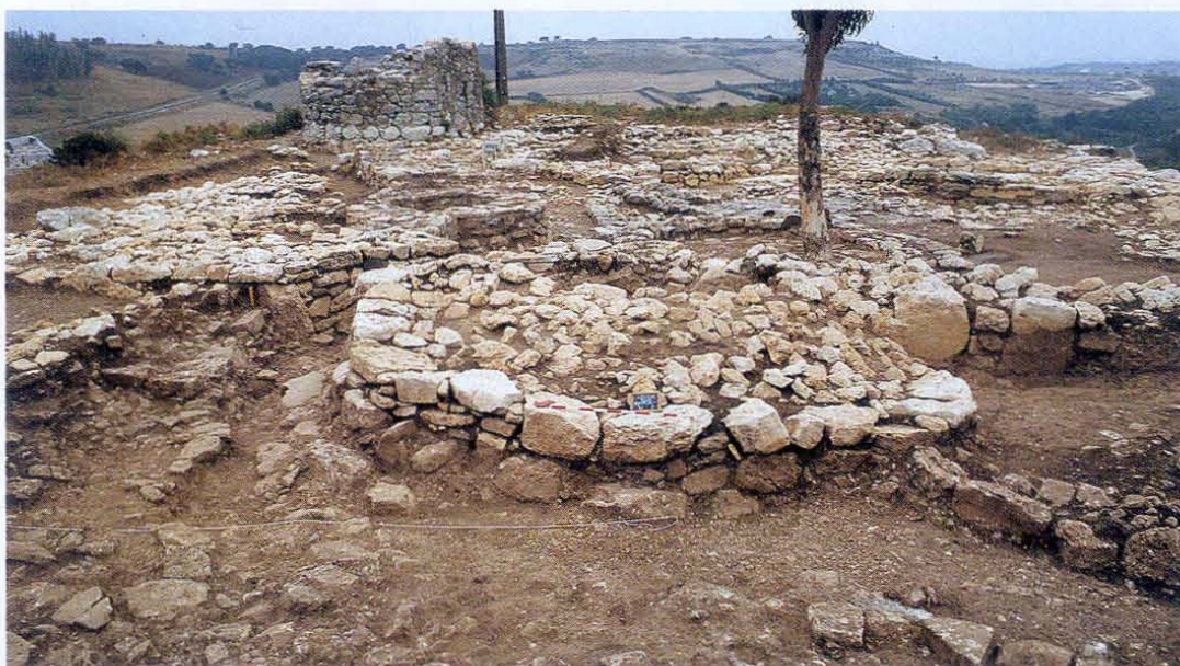
Leceia 1988. Vue du côté externe de la deuxième ligne défensive. Au centre, bastion U près de l'entrée 01. Deuxième phase de construction, début du Chalcolithique Initial.

Les recherches menées sur le site de Leceia ont mis en lumière l'existence, dès le Néolithique Final (fin IV e -début III e millénaire av. J.-C.), et davantage au Chalcolithique (III e millénaire), d'une société bien organisée et disposant d'assez de ressources pour être capable d'édifier de puissantes fortifications et d'accumuler des surplus indispensables au fonctionnement du troc.