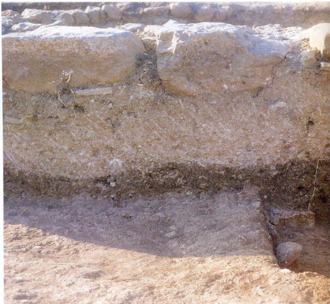
Leceia 1990. Vue de l'extérieur du bastion EI appartenant à la première ligne défensive. Deuxième phase de construction du début du Chalcolithique Initial.

ment de cette métallurgie en Estrémadure. La fabrication de pièces en cuivre à Leceia, durant le plein Chalcolithique, est assurée par l'existence de coulées et de scories de fonte, certaines d'entre elles ayant été découvertes dans des foyers domestiques, ce qui prouve que la métallurgie ne constituait pas une activité spécialisée, effectuée par un groupe différencié au sein de la communauté.