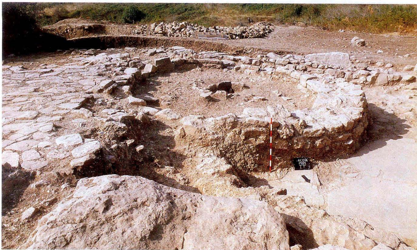
Leceia 1989. Vue générale de la maison zz – troisième phase de construction, du Chalcolithique Initial moyen – partiellement surmontée, à gauche, par le chemin AC, quatrième phase de construction de la fin du Chalcolithique Initial.

étaient présents tout au long du Chalcolithique. Excepté les différences notées au niveau des modèles décoratifs et des techniques respectives, il demeure cependant une continuité dans la typologie du mobilier restant (osseux et lithique) ; rien n'indique l'existence de grands soubressauts dans la vie socio-économique de ces populations durant le passage du Chalcolithique Initial au plein Chalcolithique.