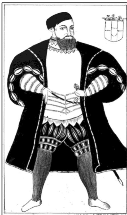
Ilustração 3 - D. Duarte de Meneses