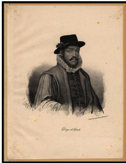
Gravura de Diogo do Couto (1542-1616)