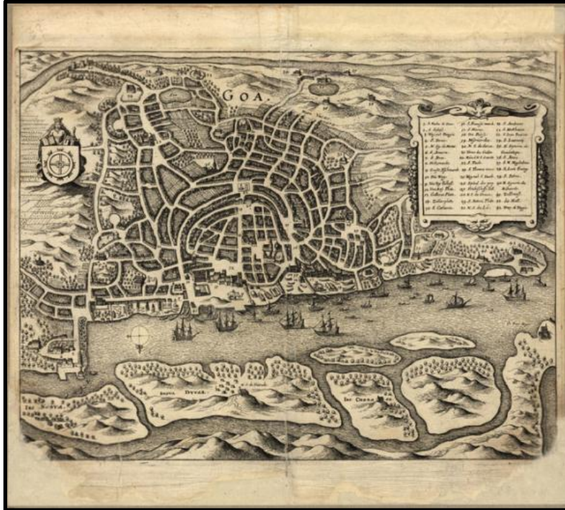
Gravura de Goa, cidade onde viveu Gaspar Correia (c. 1492- c. 1565)