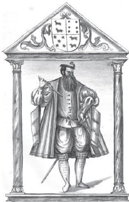
Ilustração 4 – Desenho do governador Jorge Cabral por Gaspar Correia

Fonte: Lendas da Índia , Livro Quarto, Tomo IV, Parte II, pp. 680-681