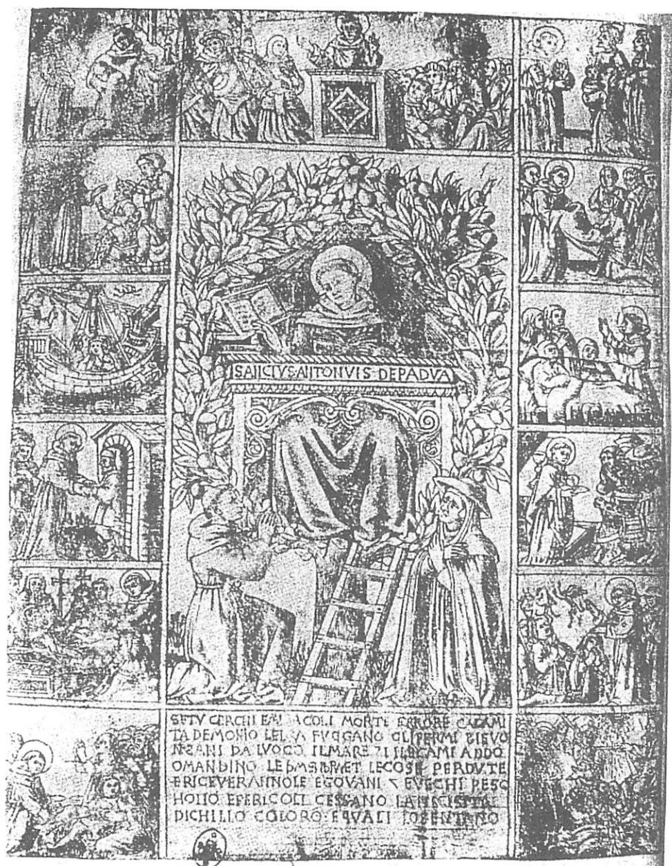
FIGURA 3 - "mandou preparar na copa de uma nogueira larga e frondosa três celazinhas de esteiras..." in Illustrated BARTSCH