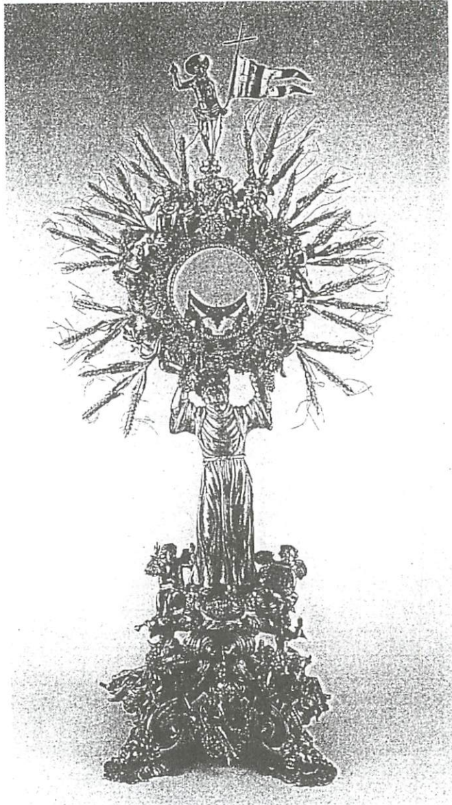
FIGURA 2 - Ostensório veneziano.

“Porque basta que haja merecimento em algo, para que St.º Antonio, ao modo do Santissimo Sacramento, estenda o beneficio a todos”.