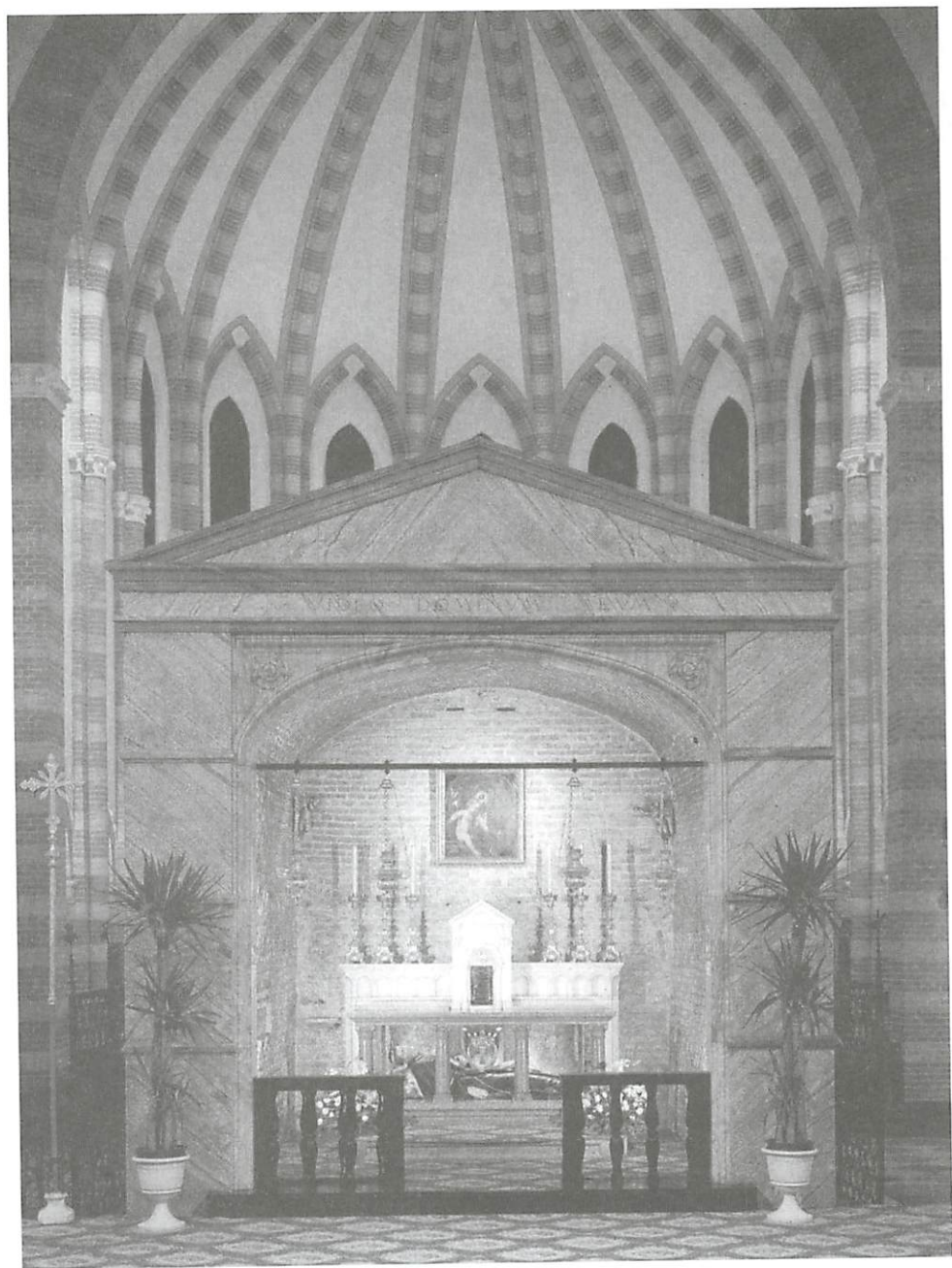
FIGURA 4 - Arcella - Capela do Trânsito "Video Dominnum meum"