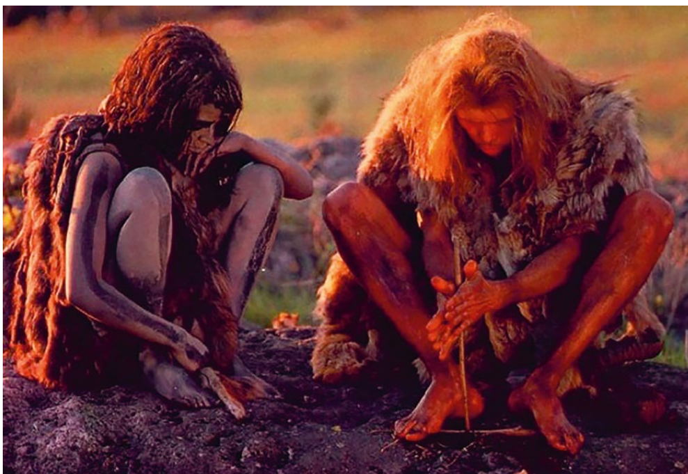
Fotograma do filme «A Guerra do Fogo», 1981, realizado por Jean-Jacques Annaud, uma produção franco-canadiana e norte-americana.

tudo seja feito de uma determinada forma, pelo que o ensino envolve obrigatoriamente processos de cooperação e altruísmo. Os processos de aprendizagem social são fundamentais para a aquisição de novos comportamentos, informações e capacidades e estão ligados ao desenvolvimento cognitivo e neurológico dos nossos antepassados, permitindo o reconhecimento das propriedades físicas dos materiais disponíveis na natureza e a produção de utensílios diversos.