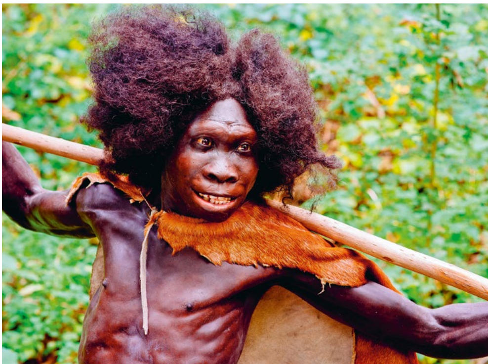
Homo erectus «Menino de Turkana» (detalhe) Nariokotome, Quênia, reconstrução no Museu Neandertal.

Durante grande parte do Paleolítico, os nossos antepassados eram nómadas e dependiam diretamente dos recursos naturais existentes em seu redor para po-