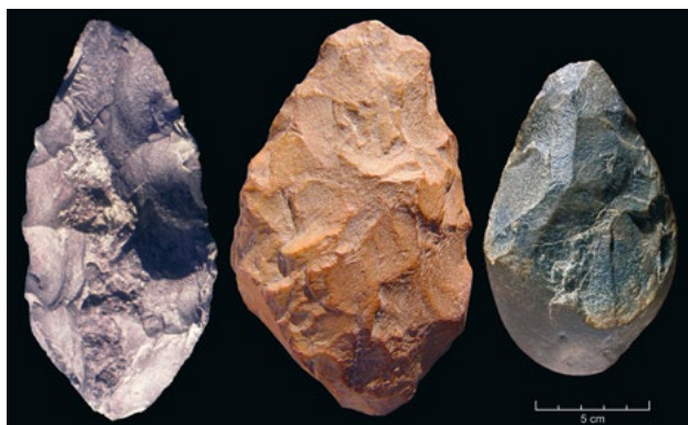
Bifaces provenientes de jazidas portuguesas. Da esquerda para a direita: Biface de quartzito da gruta da Furninha, Peniche, recolhido por Nery Delgado em 1880; Biface de quartzito de Leião, Oeiras; Biface de lidito da Ericeira, Mafra.

Uma nota importante deve ser sublinhada aqui relativamente à Gruta da Aroeira. Recentemente foi aí encontrado um fragmento de um crânio fóssil de homínido associado a bifaces acheulenses. A análise dos utensílios em pedra lascada sugere uma mobilidade limitada dos grupos humanos, com atividades de talhe realizadas no local e bifaces introduzidos já como utensílios acabados. A presença de subprodutos de combustão parece indicar já o uso controlado do fogo por essas nossas populações antepassadas, que ali viveram há mais de 400 mil anos atrás.