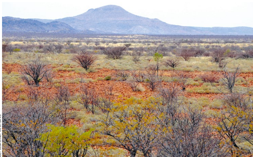
Paisagem típica de Veldt perto da floresta petrificada na Namíbia.

Os primeiros hominídeos, em África, enfrentaram condições ambientais extremamente desafiadoras e, para sobreviver, foram obrigados a criar e transmitir conhecimentos sobre a natureza, a obtenção de alimentos e a produção de ferramentas feitas em pedra, osso e madeira. De facto, esses nossos antepassados divi-