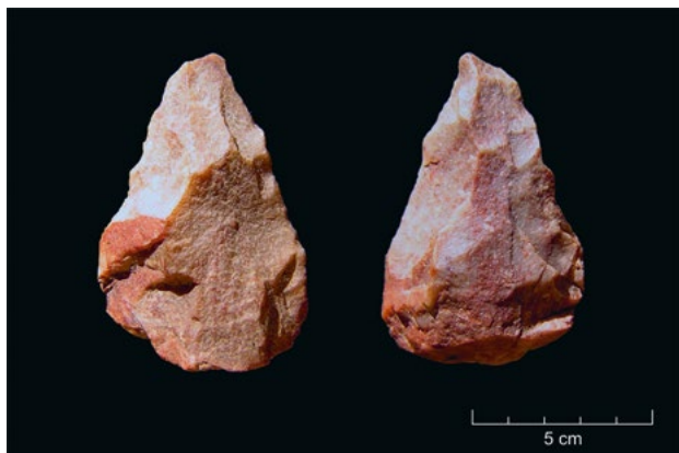
Biface de quartzito (duas vistas) de Belver (vale do Tejo).