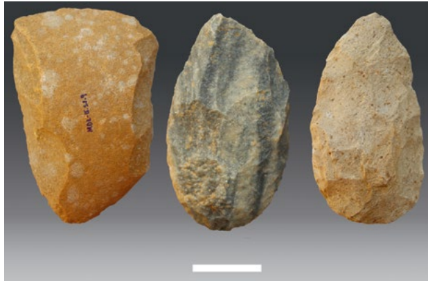
Bifaces e machado (à esquerda) em quartzito da «Early Stone Age» da zona de Massingir (Parque Nacional do Limpopo), Vale do Rio dos Elefantes, Moçambique.

expandiu-se, beneficiando-se da colaboração com investigadores estrangeiros e de projetos interdisciplinares como metodologias e tecnologias avançadas.