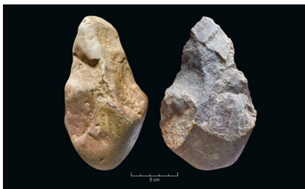
Bifaces em quartzito de Monte do Campo (Caia) e Ramalhosa (Torres Vedras). Note-se, no caso do primeiro, o estado de rolamento das arestas devido a ações naturais das águas fluviais.