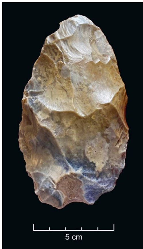
Biface em sílex da jazida francesa de Saint Acheul, França. Esta jazida deu o nome ao Acheulense e foi um dos locais onde primeiro se referenciou o biface como um instrumento pré-histórico. Fotografia de João Luís Cardoso.

Os bifaces acheulenses são feitos de pedra como o sílex, o quartzo ou quartzito e mais raramente em obsidiana, e são formatados através de técnicas de lascamento. Os bifaces possuem uma grande variedade de formas, incluindo lanceoladas, ovais e cordiformes e de dimensões, desde pequenos bifaces com menos de 10 cm de comprimento até peças com dimensões superiores a 30 cm e com vários quilogramas, como é o caso dos bifaces descobertos na jazida de Monte de Famaco, num dos terraços do Tejo, perto de Vila Velha de Rodão. A fabricação dessas ferramentas envolvia técnicas avançadas de pedra lascada bifacial, onde ambos os lados da pedra eram trabalhados para criar uma aresta afiada.