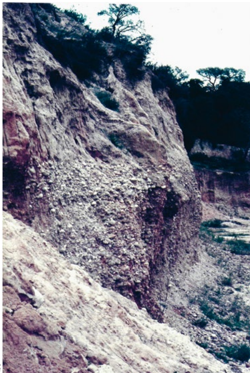
Fotografia do corte da secção inferior da cascalheira do Vale do Forno, Alpiarça, onde foi encontrada indústria Acheulense com bifaces. A parte superior do corte corresponde a depósitos mais finos formados no decurso do enchimento progressivo do vale, resultante do movimento transgressivo do nível marinho. Este corte é de grande importância histórica para o estudo da geologia do Quaternário e da Pré-história de Portugal. Foi destruído no início da década de 1980 aquando da construção de uma pequena albufeira no local.

Em Portugal, diversas jazidas arqueológicas têm fornecido dados valiosos sobre as indústrias líticas acheulenses, contribuindo para a compreensão da ocupação humana no território durante o Plistocénico Médio, espalhando-se um pouco por todo o país. São talvez mais relevantes as regiões do litoral do Minho, do litoral da Estremadura, o vale do Lis e sobretudo, o vale do Tejo, nomeadamente a zona de Torres Novas, na margem direita e de Alpiarça,