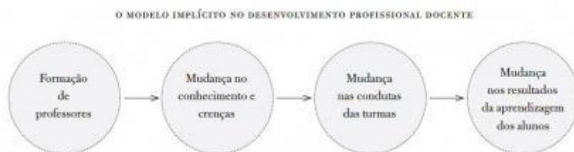
Figura 1 – Modelo implícito no desenvolvimento profissional docente

nas práticas dos professores em sala de aula e, como consequência, haverá uma mudança no sentido da melhoria dos resultados da aprendizagem dos alunos.