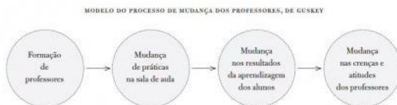
Figura 2 – Modelo do processo de mudança dos professores (Guskey,1986)

Em investigações realizadas por Guskey & Sparks (2002), estes autores encontraram evidências de que a mudança operada nas crenças e conhecimentos dos professores resulta da comprovação na prática e em sala de aula da utilidade e exequibilidade de novas práticas. Assim, a participação em actividades de desenvolvimento profissional, por si só, não conduzem a uma mudança. Estes autores, propõem o modelo ilustrado na Figura 2, segundo o qual, a mudança é um processo em que os professores como aprendentes activos mudam através da reflexão e na prática, isto é, a simples participação em actividades de desenvolvimento profissional não produz, por si só, mudança. Esta acontece quando comprovam na prática, a utilidade e exequibilidade das práticas que se pretende ver desenvolvidas.