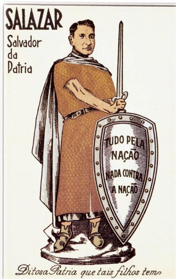
Figura 1 – “Salazar salvador da pátria.” 70

o político cada vez mais “se submetia ao religioso” (idem, p. 283), sendo que um candidato católico chegou a afirmar que venceria uma eleição se Deus e Nossa Senhora lhe concedessem a vitória e não porque o povo o elegeria.