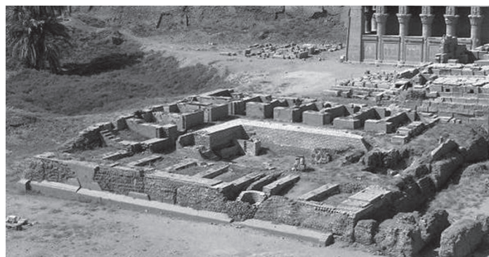
Fig. 3. Foto do sanatorium de Dendera