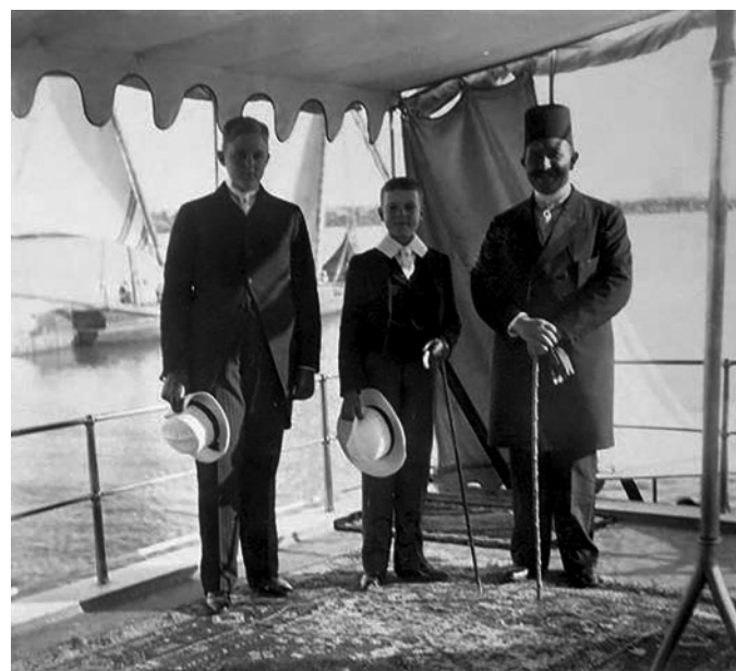
Figura 2 – O Khediva Abbas II com os príncipes (ORLEÃES, 1903, s/p).