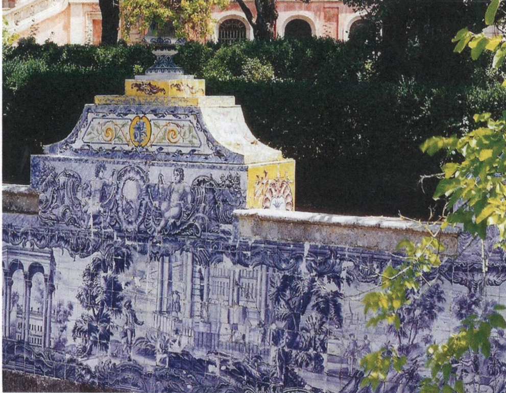
Canal grande do jardim do Real Palácio de Queluz. Muro com revestimento cerâmico, 1775-1776.