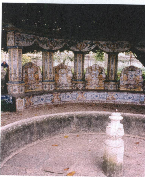
Quinta dos Azulejos no Paço do Lumiar, Lisboa. Revestimento azulejar. Pérgula.