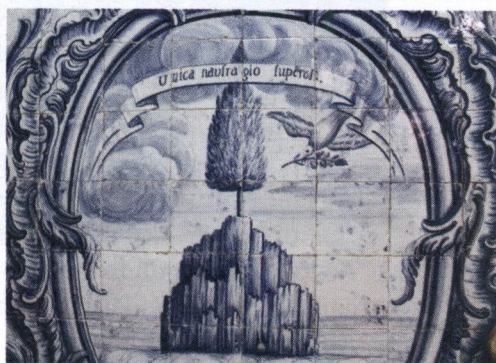
Painéis de temática mariana da Capela de Nossa Senhora de Monserrate, Lisboa, 1783.