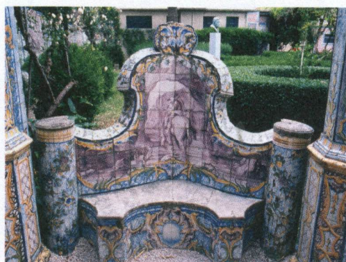
Quinta dos Azulejos no Paço do Lumiar, Lisboa. Conjunto de bancos.

O contraste de cor e ritmo entre o interior e o exterior azul assume um papel curioso ao distinguir a parte interna, aquática, pela coloração do azul-cobalto dos azulejos que se