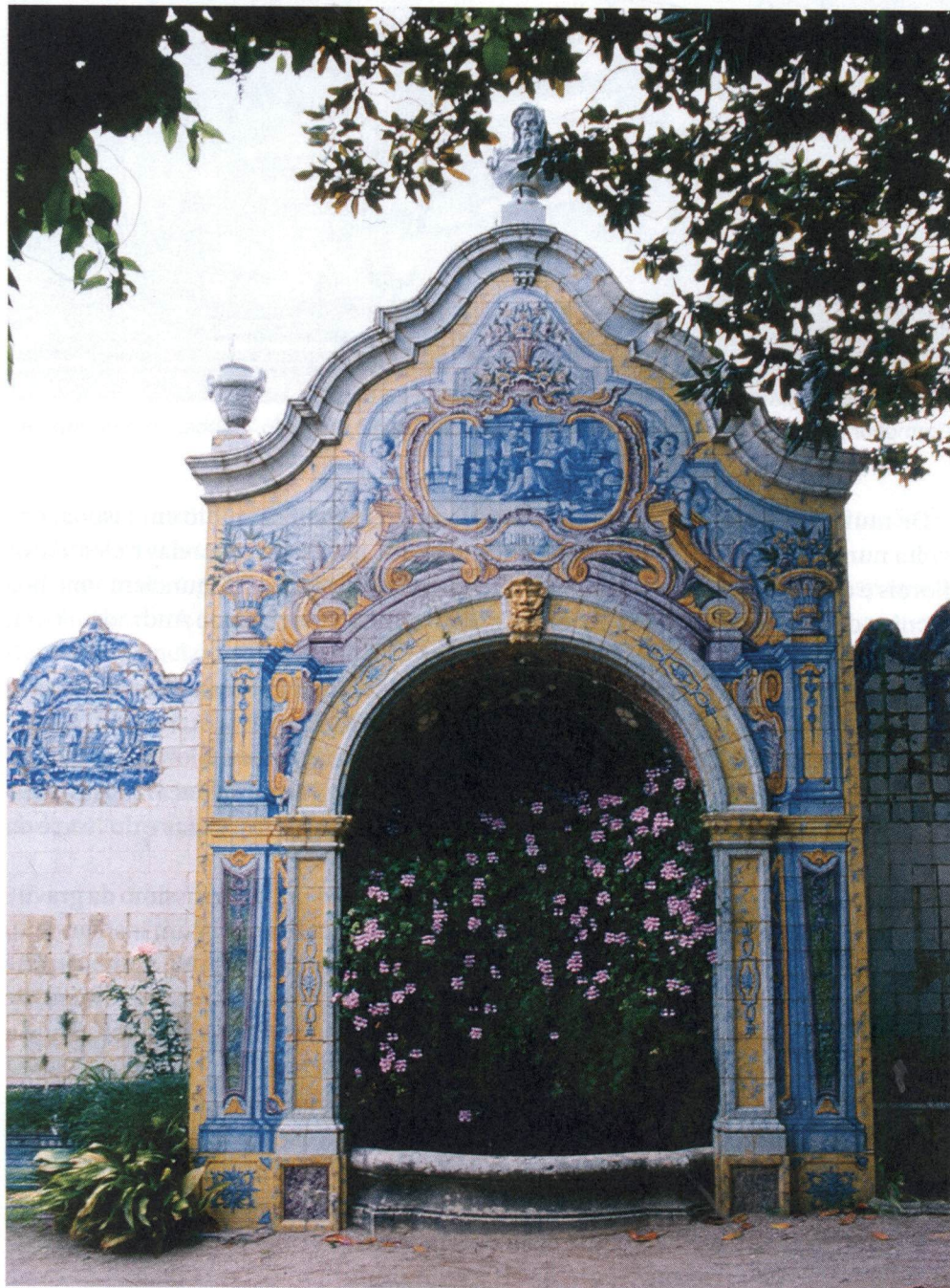
Composição figurativa. Conjunto «Fonte da Europa», 1760-1785.

NO QUE DIZ RESPEITO À TEMÁTICA PROFANA ACENTUA-SE A ESSÊNCIA DO ESPÍRITO DESTA ÉPOCA SURGINDO NA AZULEJARIA COMO UM VOCABULÁRIO SOCIAL RECRIANDO VIVÊNCIAS, PRAZERES E CENAS DE GÊNERO