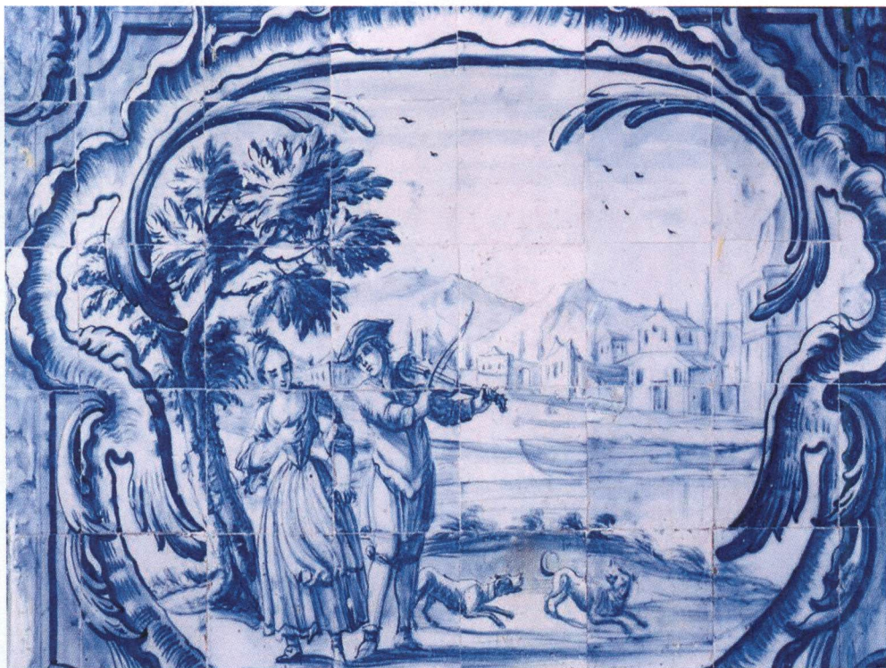
Palácio Rebelo de Andrade – Ceia, na Rua da Escola Politécnica, Lisboa. Painéis de azulejo figurativo, representação de cena ao ar livre.

Augsburgo foram neste período centros bastante importantes de exportação de modelos artísticos.