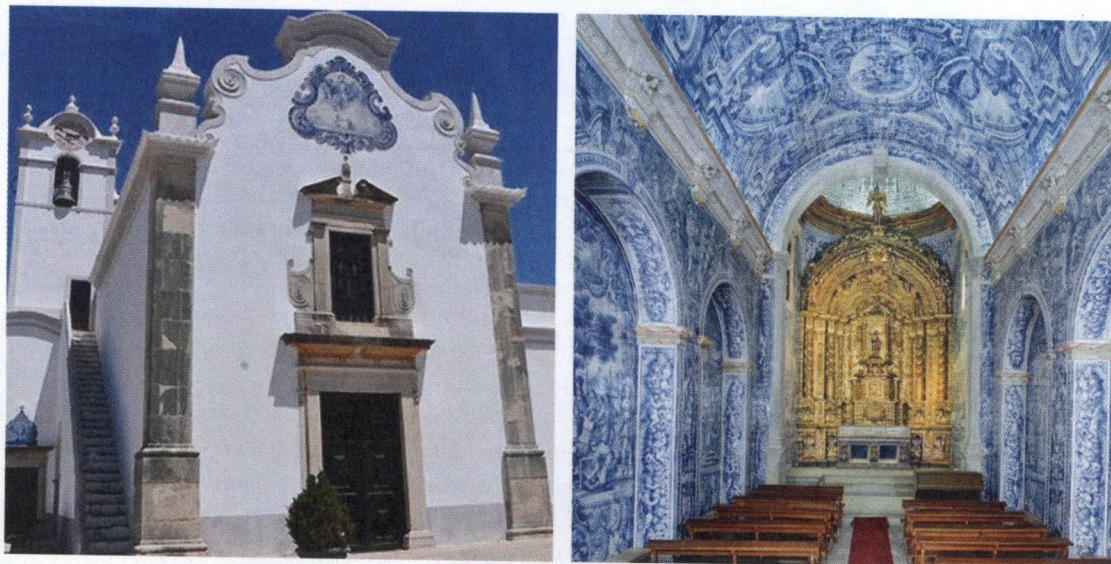
Igreja de São Lourenço em Almancil. Fachada e Interior.

Considerando a linha do tempo, este longo e vasto período assume diferentes ciclos de gosto, a Grande Produção , assim designada, uma fase pré-terramoto, onde o terramoto é apenas um acontecimento histórico que nos facilita uma arrumação cronológica, a azulejaria pombalina seguida de uma fase de maturidade do Rococó, incluindo o período mariano e o despontar do Neoclassicismo, com