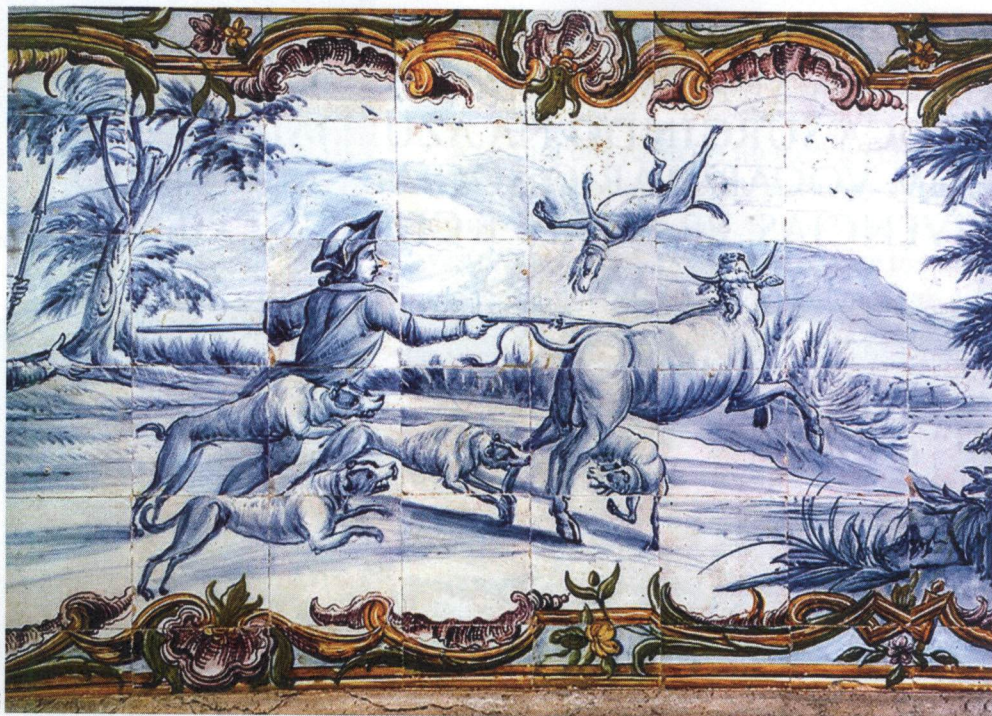
Pormenor de revestimento azulejar da escadaria do Palácio Lavradio, Lisboa.

De muitos exemplos destacamos a escadaria do Palácio Lavradio em Lisboa, envolta numa graciosa cercadura policroma formada por faixas amarelas e elementos florais e concheados, cenas de género, rústicas e campestres, denunciam uma boa técnica de pintura cerâmica e, o andar nobre do Palácio Rebelo de Andrade – Ceia, na Rua da Escola Politécnica em Lisboa.