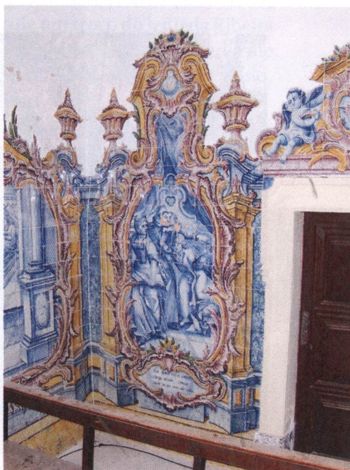
Convento de S. Bento de Cástris, Évora. Ciclo narrativo de S. Bernardo.