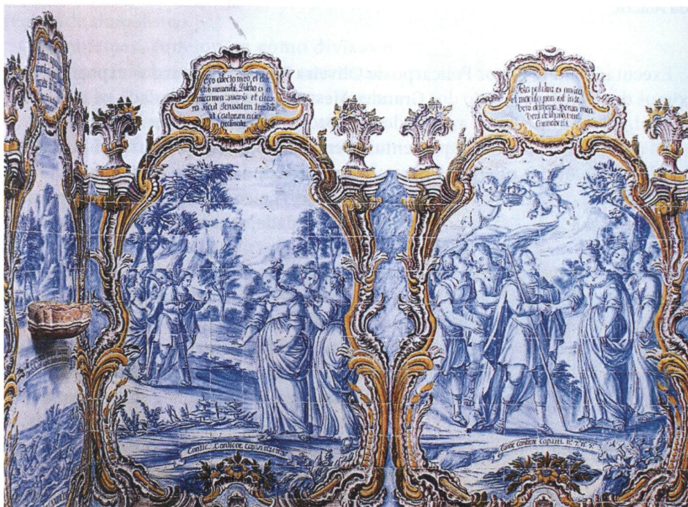
Painéis azulejares da Capela da Quinta de Nossa Senhora da Vitória em Camarate.

Como exemplo paradigmático e singular de um grande conjunto do azulejo barroco, destacamos o interior da Igreja de São Lourenço em Almancil no Algarve.