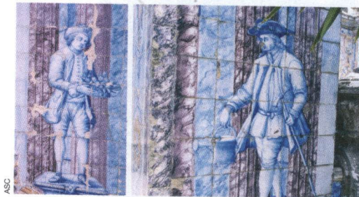
Quinta dos Azulejos no Paço do Lumiar, Lisboa. Figuras de convite.