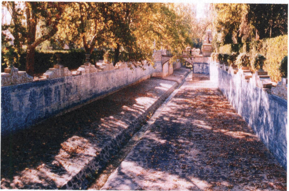
Canal do lago grande do jardim do Real Palácio de Queluz.

No que diz respeito à temática profana acentua-se a essência do espírito desta época surgindo na azulejaria nas mais variadas enunciações, assumindo-se como um vocabulário social recriando vivências, prazeres e cenas de género. Acentua-se uma vertente cognitiva das temáticas, e potenciadora de leituras muito dinâmicas, precisamente pela animação decorativa em espaços exteriores, abertos: jardins, tanques, fontes, casas de fresco, terraços, varandas, escadarias, pérgulas, entre muitos outros.