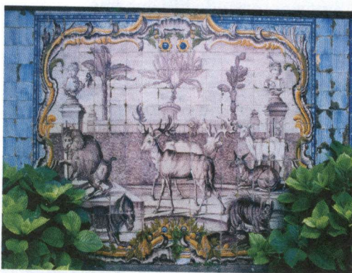
Quinta dos Azulejos no Paço do Lumiar. Painel figurativo.

estendem por vastos painéis contínuos, da estrutura arquitetónica exterior onde predominam outras cores.