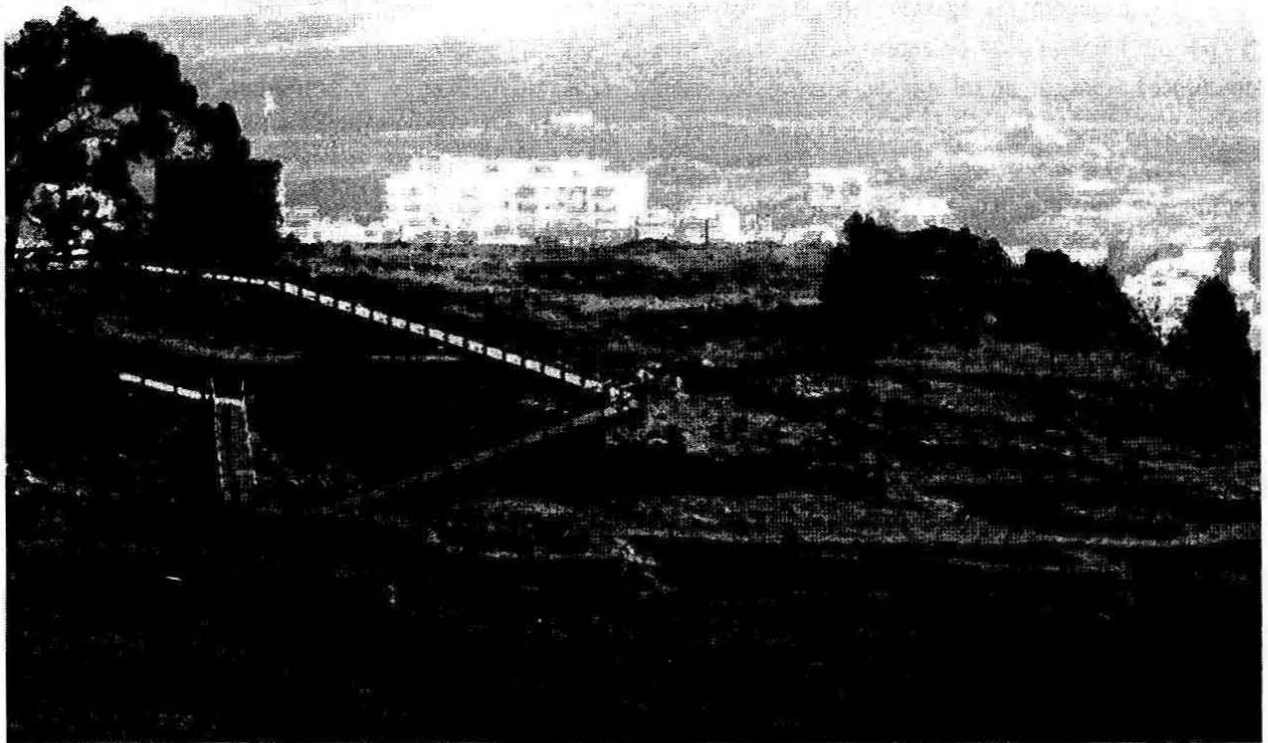
3. Vista do povoado pré-histórico, tomada de ocidente, com a passareira de madeira parcialmente visível, à esquerda.

plexo levado a cabo, desde há vários anos, pelo Gabinete de Contencioso e Apoio Jurídico da Câmara Municipal de Oeiras, mas dificultado pelo elevado número de proprietários e seus descendentes. Actualmente, algumas das parcelas são já propriedade municipal, e de outras, foi requerida pelos donos, a respectiva expropriação, como prevê a legislação em vigor.