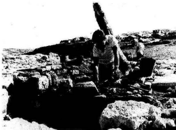
2. Pormenor dos trabalhos de restauro e consolidação de estruturas arqueológicas, realizados em Leceia.

Tendo presente que um dos objectivos finais dos trabalhos encetados em 1983 consistia na escavação integral, seguida da recuperação, deste grande povoado calcolítico fortificado, com vista ao seu usufruto cultural, iniciaram-se em 1988 acções de restauro, consolidação e recuperação das estruturas arqueológicas entretanto postas a descoberto (Fig. 2). Os primeiros trabalhos integraram-se numa experiência-piloto, recorrendo a formandos de curso então ministrado em Conímbriga, e tiveram o apoio do então Director do