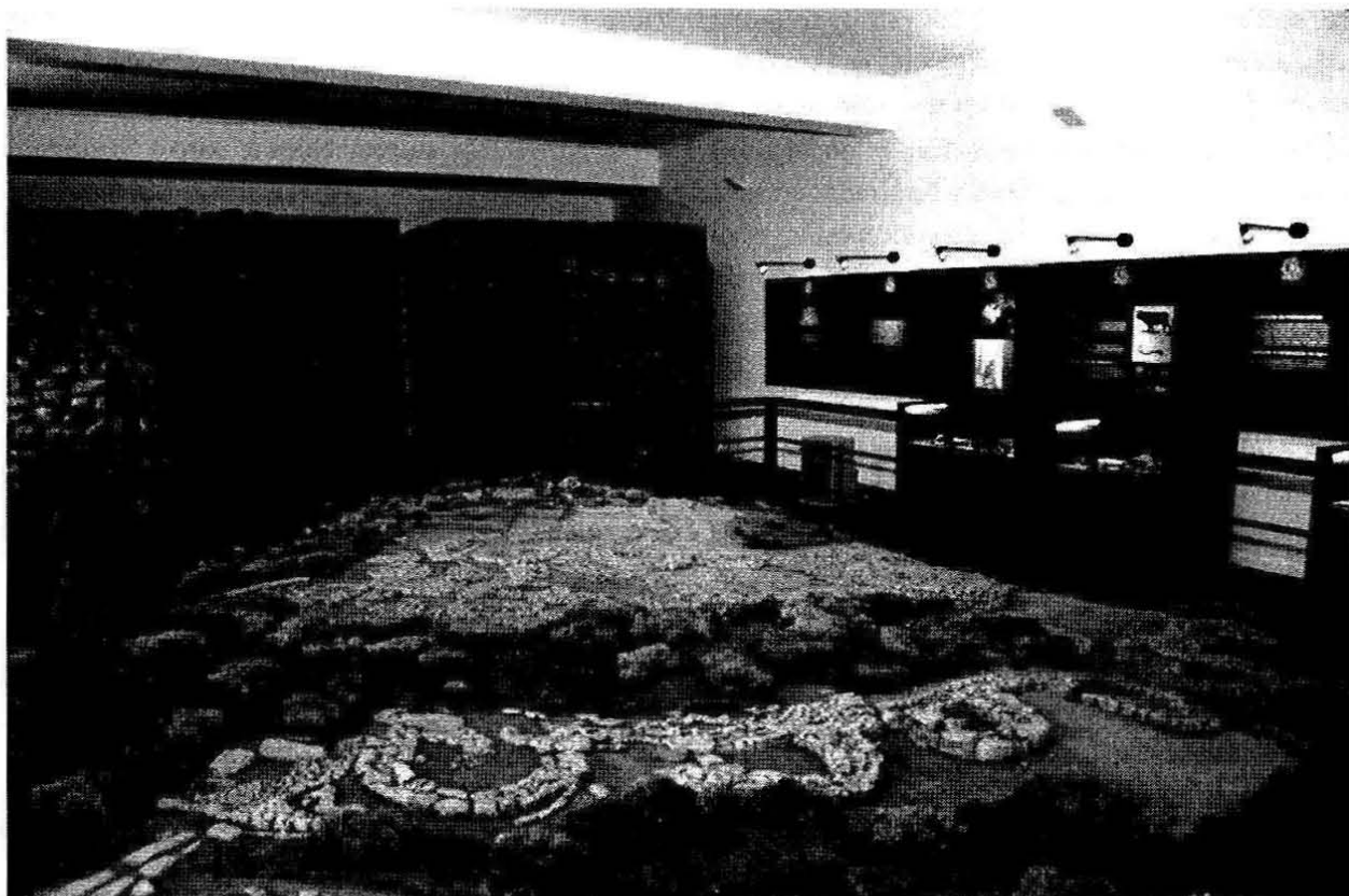
4. Vista parcial da exposição monográfica permanente dedicada ao povoado pré-histórico de Leceia, patente ao público na Fábrica da Pólvora de Barcarena (Oeiras).

estes se podem ver: a iniciativa em apreço permitiu responder adequadamente a esta questão (Fig. 4).