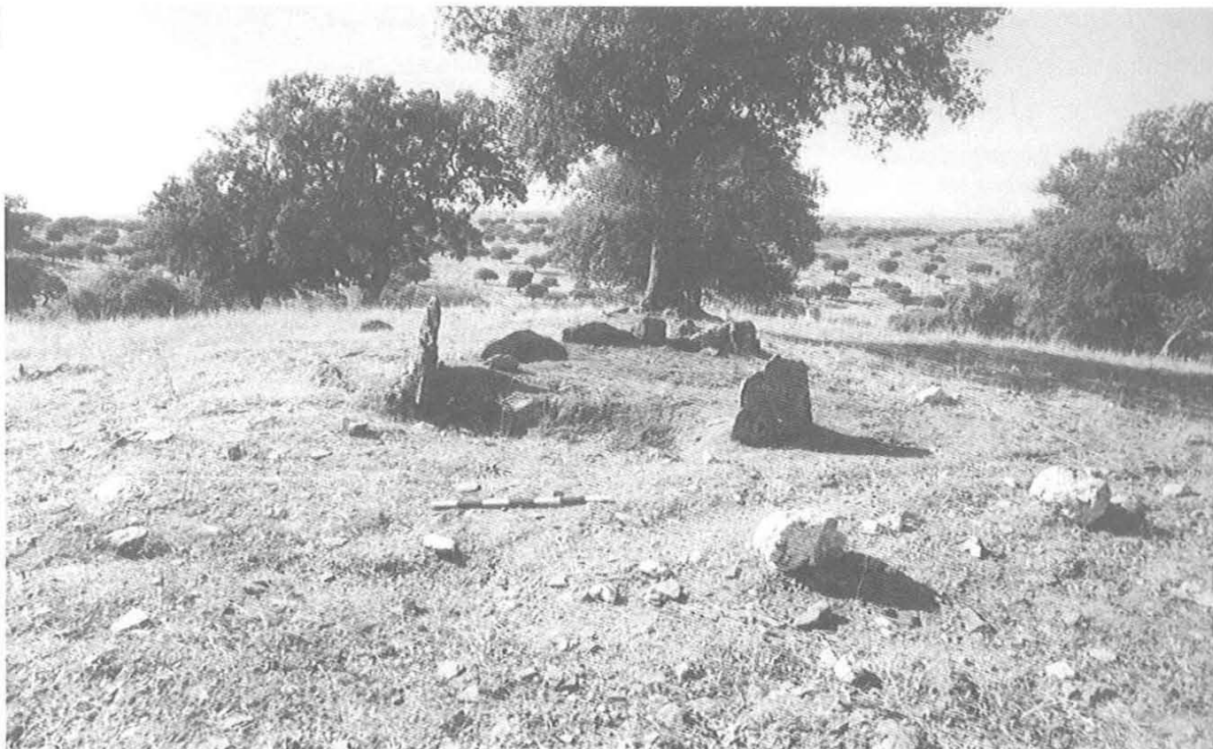
A anta 2 do Couto da Espanhola (Rosmaninhal) antes do início dos trabalhos arqueológicos

pedunculada com aletas laterais e de base pedunculada; contas de rochas verdes, de calcedónia translúcida e de xisto; lamelas, furadores e lâminas de sílex, com ou sem retoques; percutores de quartzo; núcleos de quartzo leitoso, quartzo hialino e quartzito; disco de xisto; polidor-brunidor de quartzito; machados de anfiboloxisto de secções subcircular, quadrangular e rectangular; enchós, goivas e escopros de anfiboloxisto; amoladeira de grauvaque; fragmento de braçal de arqueiro de xisto; denticulados, triângulos, crescentes e trapézios de sílex; taças de calote, carenadas e hemisféricas; vasos de vários tipos; e fragmentos de placas de xisto decoradas, de tipo alentejano. Parte deste espólio resulta da reutilização de alguns dos monumentos até ao presente estudados (conforme, entre outros, o trabalho de síntese dos signatários publicado no vol. 2 das Actas do II Congresso de Arqueologia Peninsular, Zamora, Fundación Rei Afonso Henriques, 1997).