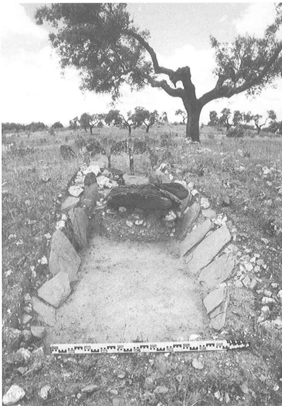
Corredor e câmara da anta 3 do Amieiro, em Idanha-a-Nova