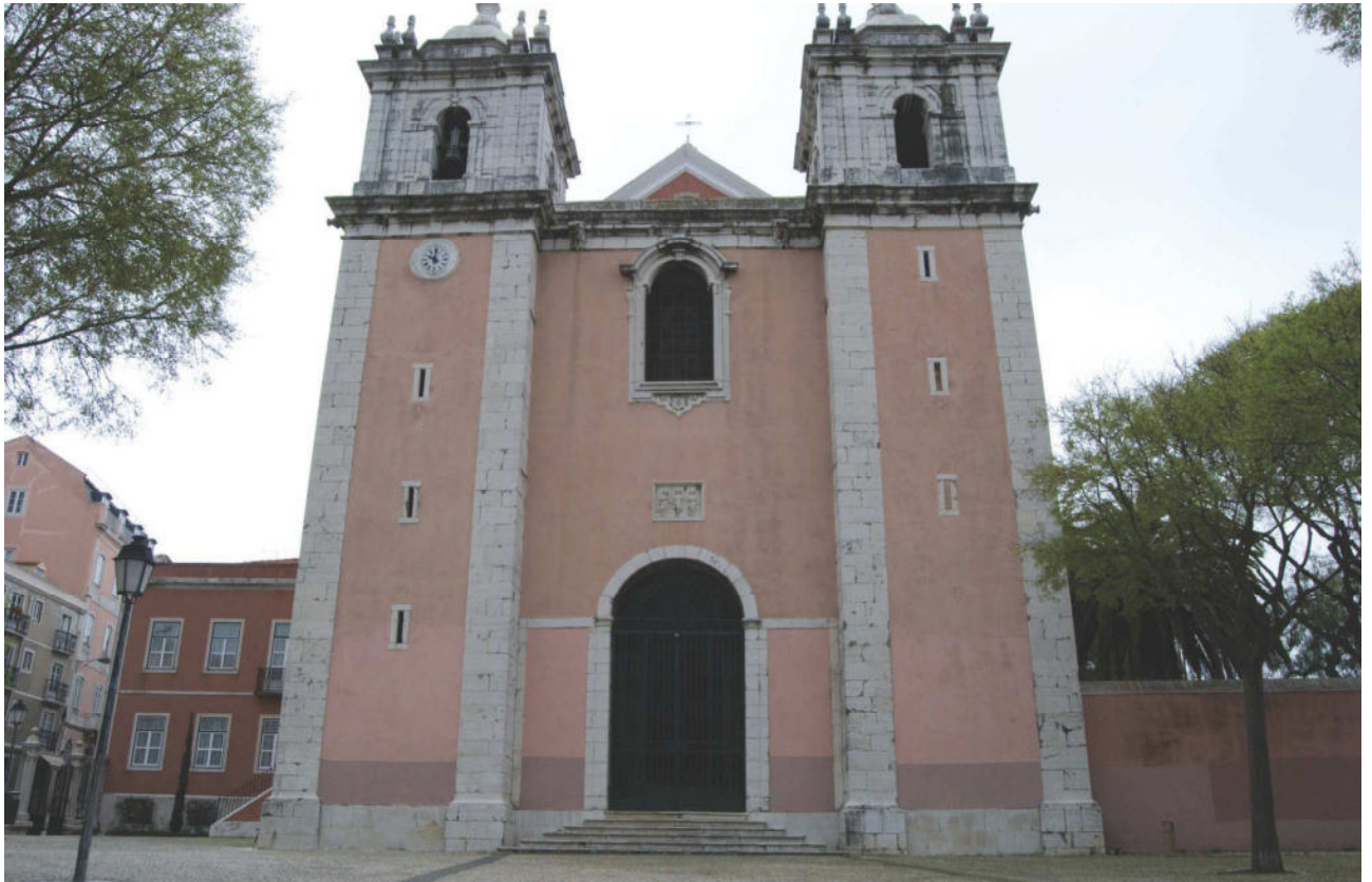
Fachada principal da igreja de Santos-o-Velho