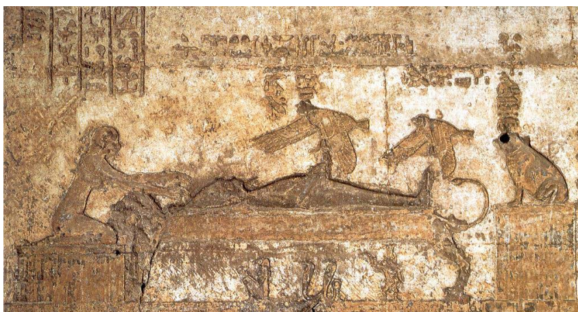
Fig. 2. A união de Ísis (falcão) com Osíris. Relevo no tecto de uma capela do templo de Hathor, em Dendera (Período Ptolomaico tardio).

A iconografia ísaca, muito estereotipada, apresenta a deusa quase sempre com um comprido vestido, justo ao corpo (as vestes típicas das divindades), de pé ou sentada, com a coroa hathórica de chifres liriformes encerrando o disco solar, segurando os ceptros uas ou uadj e com o signo ankh numa das mãos. Muitas das suas representações esculpidas (em pedra, madeira ou metal), pintadas ou em baixo-relevo mostram-na amamentando o pequeno Hórus, que senta ao seu colo, sobre as coxas, oferecendo-lhe o seio esquerdo ( Isis lactans ) – Fig. 3 7 . Entre os símbolos sagrados de Ísis, que permanecerão ao longo dos séculos, estão o tyet ou «nó ísaco», o sistro sechechet e a sítula ou recipiente para libações de líquidos, designadamente de leite, directamente relacionados com os seus atributos – Fig. 4 8 .