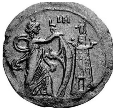
Fig. 5. Moeda com Isis Pharia , com a sua vela e o farol de Alexandria.

Em Alexandria, a antiga deusa egípcia preserva a sua faceta de Isis Lactans , a «amamentadora» de Hórus, que conheceria enorme difusão um pouco por todo o lado e praticamente em toda a espécie de objectos (moedas, baixos-relevos, ex-votos , estelas decorativas, terracotas, etc.), chegando a ser representada coberta de múltiplos seios, como Ártemis de Éfeso. Simultaneamente, assume outras funções, como Isis Euploia ou Isis Pelagia , «Ísis da feliz navegação», ou seja, divindade protectora dos ventos, inventora da navegação e patrona dos marinheiros, mas também da fertilidade dos campos. Devido ao seu templo na ilha de Faros, em Alexandria, Ísis era também honrada como Isis Pharia – Fig. 5 13 .