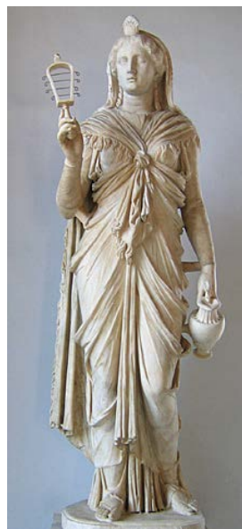
Fig. 4. Estátua de mármore de Ísis, segurando na mão direita um sistro e na esquerda uma sítula, encontrada em Tivoli (117-138). Rome, Palazzo Nuovo.

A partir de 700 a.C., através de estatuetas de bronze e amuletos de faiança, a imagem de Isis lactans , deusa amamentadora, espalha-se rapidamente. O lactans ou o gesto de oferecer o seio para amamentar ou o acto de aleitar tinha um simbolismo específico no antigo Egipto: simbolizava que o leite oriundo do divino é representativo de alimento de vida e de divindade (Cf. Tinh, Labrecque, 1973: 1; Tinh, 1973: 1231-1268). As representações tradicionais de Ísis com o menino vão progressivamente sendo afeiçoadas e de uma relação fria, indiferente, estereotipada e distante, entre mãe e filho vai chegar-se a situações de enorme comunicação e afecto entre ambos. Não é alheia a esta humanização das representações a introdução de uma nova técnica de origem grega: a da terracota modelada (Cf. Dunand, 2000: 38). Françoise Dunand enfatiza a diferença entre os tipos de representação egípcio e grego dizendo : «Une grande différence entre les représentations égyptiennes de ce thème, hiératiques et sans vie, et les images grecques qui seraient des “scènes de genre”, des représentations d’une “idylle divine sous une forme idéalisée”» (Dunand, 1973, 95).