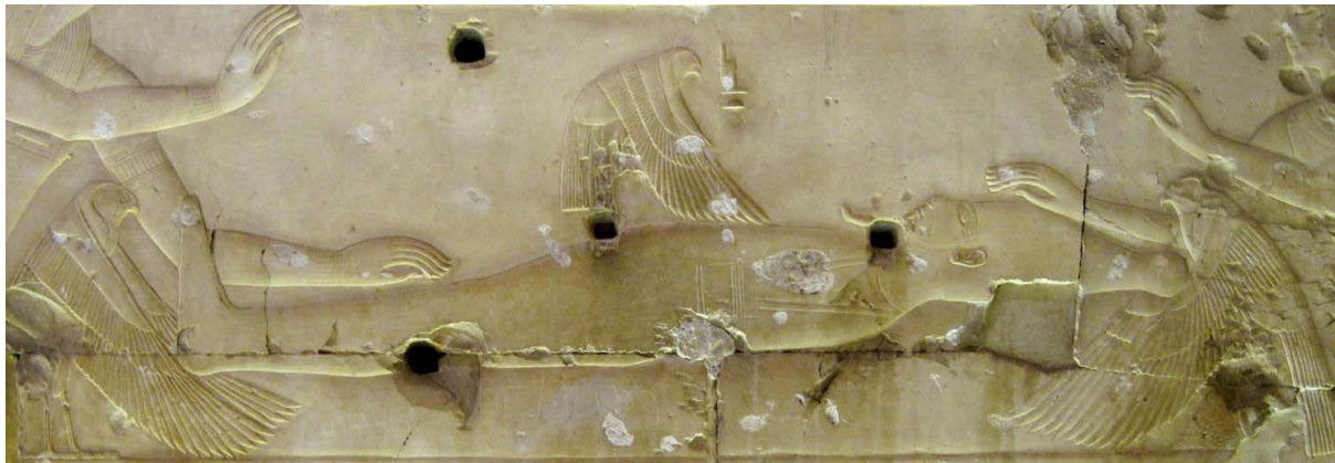
Fig. 1. Isis como falcão sobre o corpo de Osíris. Baixo-relevo do templo Seti I, em Abidos (Império Novo, XIX Dinastia).

deusa protectora da família, da maternidade e da infância, a sua acção estendia-se aos perigos físicos e metafísicos que podiam atingir mães e filhos. Por este motivo, os remédios usados eram sempre acompanhados por encantamentos em que se pedia a sua ajuda e se usava algum dos seus «componentes misteriosos»: a saliva, o leite, o sangue ou a urina (Cf. Gisbert Puyo, 2015: 276-278).