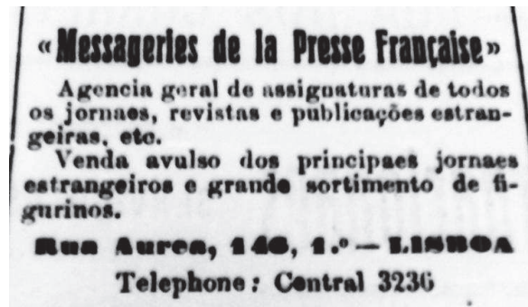
Imagem 3: Anuário Comercial de Portugal , 1919.