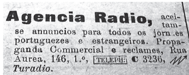
Imagem 4: Anuário Comercial de Portugal , 1921.