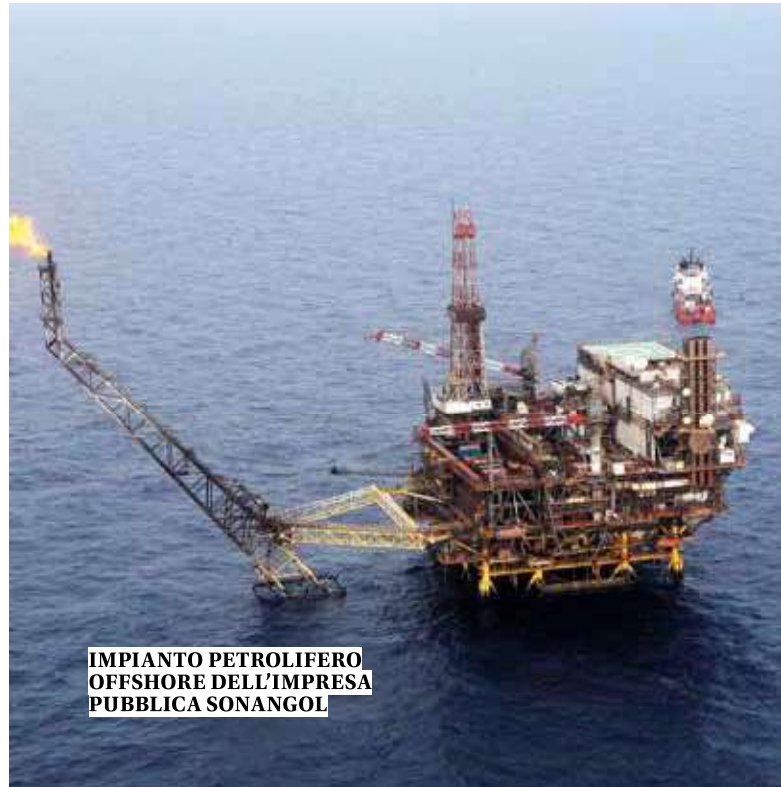
IMPIANTO PETROLIFERO OFFSHORE DELL'IMPRESA PUBBLICA SONANGOL

Il modello di sviluppo economico angolano – da molti autori e osservatori definito come “estrattivista”, in quanto si basa sullo sfruttamento di risorse naturali, in particolare petrolio, diamanti, fosfati, bauxite – deve fare i conti con la propria insostenibilità. Siamo di fronte a un modello caratterizzato da una profonda crisi multidimensionale che tocca l'ambiente, la società, le istituzioni e la politica.