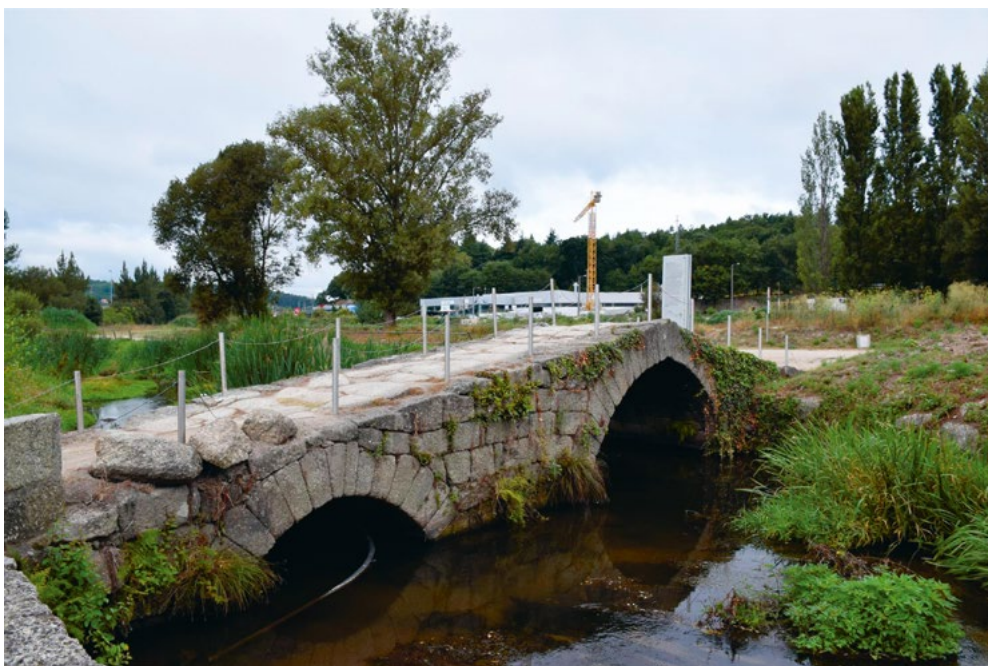
Ponte do séc.XIII, um dos possíveis locais onde terá ocorrido a Batalha de S. Mamede.

vida das forças comandadas por Afonso Henriques e a derrota dos adversários, que são mesmo chamados de «quidam indigni et alienigenae», ou seja, «alguns indignos e estrangeiros». São textos panegíricos da figura de Afonso Henriques, escritos no mosteiro de Santa Cruz de Coimbra, que esteve sempre muito apostado no enaltecimento da figura do infante e depois rei, e foram escritos já na segunda metade do século XII. Factos que devem ser tidos em conta para a sua compreensão. De facto, havia portugalenses de um lado e do outro e, mais do que contra «os galegos» ou «os estrangeiros», foi contra o entorno de Fernão Peres de Trava e seus aliados próximos que se combateu. Em todo o caso, a vitória dessa facção é um dado histórico incontroverso, assim como as suas consequências: no seu seguimento, a condessa Teresa e seus aliados foram afastados do governo da terra portugalense, regressando ou re-