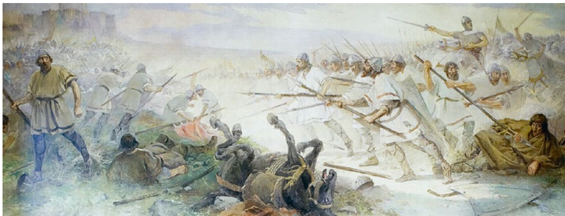
A primeira tarde portuguesa - Batalha de São Mamede, obra de Acácio Lino, 1922, fotografia de Carlos Pombo, 2005. Museu da Assembleia da República.

A batalha de S. Mamede, travada em 24 de junho de 1128, é um dos eventos mais conhecidos da história de Portugal, tendo ficado associada às origens do país. O pintor Acácio Lino pintou, em inícios do século XX, um quadro a ela alusivo e destinado à Assembleia da República, ao qual deu o sugestivo nome de «a primeira tarde portuguesa». É um acontecimento carregado de simbolismo, nem sempre sendo fácil destrinçar o que historicamente ocorreu das sucessivas leituras e mitificações que os séculos lhe foram agregando.