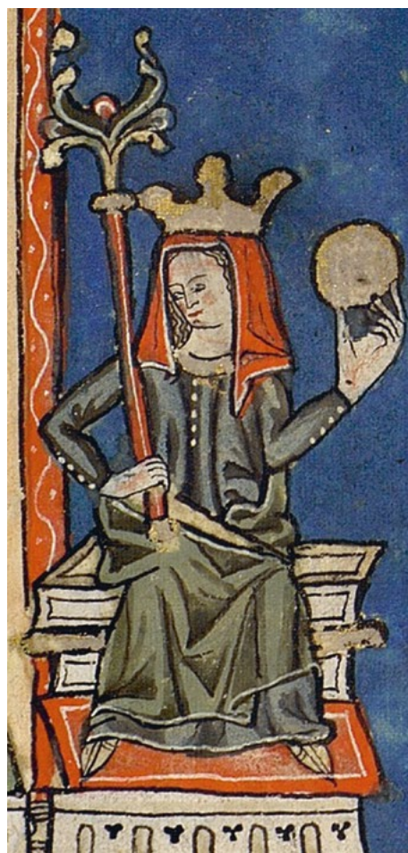
Conde D. Henrique de Borgonha (1066-1112) e D. Teresa de Leão (1080-1130), pais de D. Afonso Henriques.