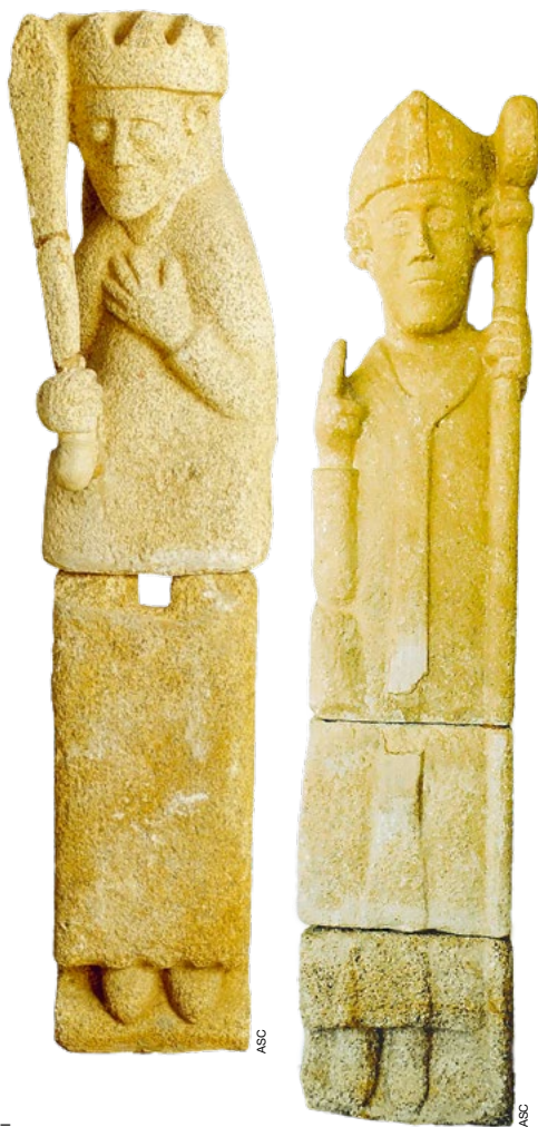
Estátuas do rei D. Afonso Henriques (?) e do bispo D. João Peculiar(?), século XII. Igreja de S. Pedro de Rates / Núcleo Museológico da Igreja de S. Pedro de Rates.

Ficaram, deste modo, estabelecidos dois campos em confronto, duas facções que lutavam pelo controlo político do território, com a possível autonomização face a Leão e Castela como pano de fundo. Uma dessas facções era comandada pela condessa Teresa, a qual, a partir de certa altura, começou a intitular-se e a ser chamada «rainha» – embora a designação tivesse à