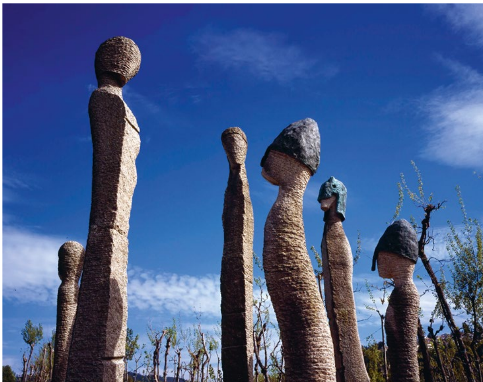
Conjunto escultórico comemorativo da Batalha de S. Mamede em Campo da Ataca (S.Torcato, Guimarães).

época também o significado de «filho de rei» não deixava de revelar os seus intuitos de incremento de estatuto político-social. A outra facção era comandada por Afonso Henriques. É neste quadro que se dá uma batalha entre ambas, justamente a batalha de S. Mamede, travada algures na região de Guimarães, em junho de 1128. Como era então relativamente frequente, decidia-se pela sorte das armas um dissenso político.