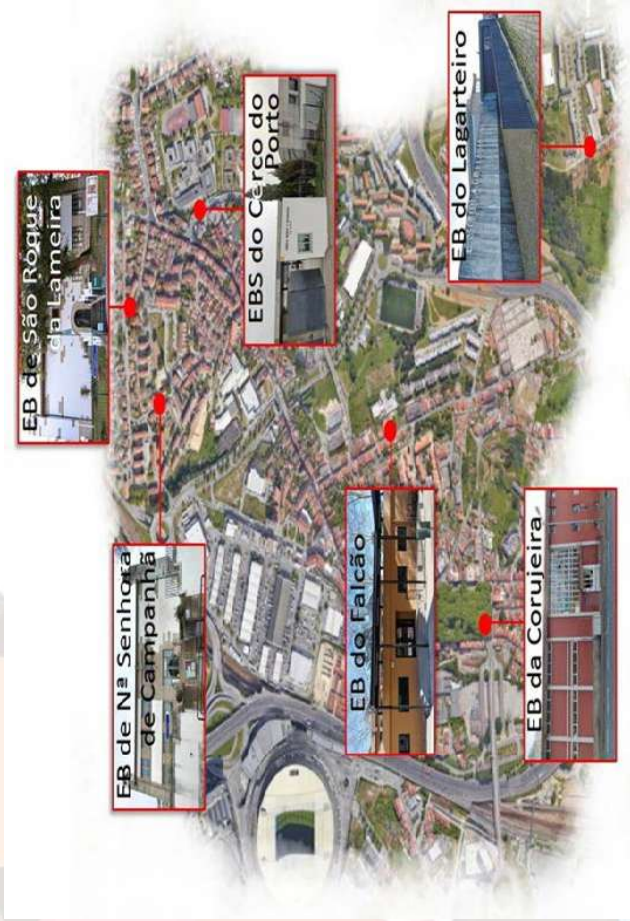
Figura 1: distribuição das escolas do AECF pelo território

de Cozinha / Pastelaria, Técnico de Eletrônica, Automação e Computação, Técnico de Gestão de Equipamentos Informáticos, Técnico de Restaurante / Bar e Técnico de Turismo (AECF, 2023). Para concretizar esta ambiciosa oferta educativa o AE estabelece uma alargada rede de parcerias e protocolos. O AECF integra a lista dos PII 16 aprovados para o ano escolar de 2024/2025 pelo Ministério da Educação e conta com uma extensa lista de parceiros nas várias áreas em que oferece os PI.