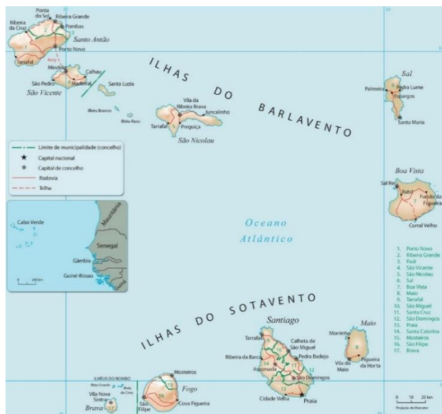
Figura 1- Guia Geográfico de Cabo Verde