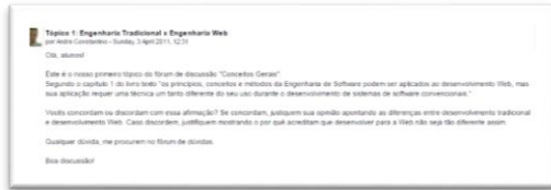
Figura 2: Postagem inicial do Fórum