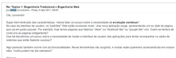
Figura 4: Segunda mensagem de sustentação do tutor – 08/04 (00:09h)

Olá LO! Super bem lembrado das características. Vamos falar um pouco sobre a necessidade de evolução contínua?