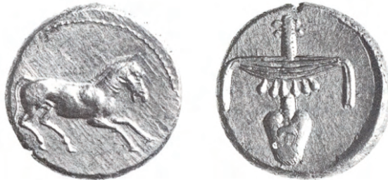
Fig. 1. Estátera, c. 8-18 g., Ø: 17 mm. Anverso: caballo salvaje a galope. Reverso: signos jeroglíficos nefer nub , «buen oro» / «oro puro» (G. K. Jenkins, Ancient Greek Coins , London, Seaby, 1990, p. 82, 224).

ñación sistemática y del uso generalizado de la moneda de la época de los Ptolomeos. No estamos aún ante una economía monetaria. 7