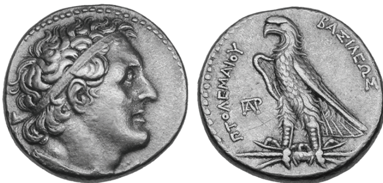
Fig. 5. Pentadracma, 17.89 g. Busto diademado de Ptolomeo I y águila vuelta hacia la izquierda sobre rayos, con la inscripción ΠΤΟΛΕΜΑΙΟΥ ΒΑΣΙΛΕΥΣ y el monograma ΠΑΡ (Ioannes N. Svoronos, Ta nomismata tou kratous tôn ptolemaíon , Atenas, 1904, 210).

imponían la obligatoriedad del cambio para toda y cualquier otra moneda traída del extranjero y eso les permitió, simultáneamente, jugar con el valor de la relación oro / plata de las monedas en las transacciones e introducir en éstas un elemento fiduciario una vez que impusieron también el uso de un patrón ligero para las monedas de plata y de bronce. El uso del oro estaba reservado para las transacciones más importantes.