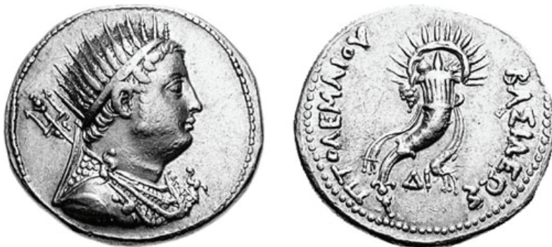
Fig. 7. Octodracma acuñado en Alejandría. 27.73 g, 12h. Anverso: Busto del deificado Ptolomeo III, con aegis y tridente. Reverso: cornucopia radiada con la inscripción ΒΑΣΙΛΕΩΣ ΠΤΟΜΕΜΑΙΟΥ y el monograma ΔΙ (Ioannes N. Svoronos, Ta nomismata tou kratous tōn ptolemaion , Atenas, 1904, 1117).

tamientos políticos y culturales de los soberanos emisores. El poder político puede imponer, como hicieron los Ptolomeos, su propia moneda o adoptar los pesos y los sistemas de denominación que más le conviene, con mayor o menor grado de aculturación y de aproximación a otros sistemas antiguos o contemporáneos. Hay, a buen seguro, en el caso de los Ptolomeos, una relación entre acuñación monetaria y soberanía / autonomía política. Estamos, de hecho, ante aquello que von Ritten llama «a state coinage». 23 Esta dimensión no existía en las emisiones anteriores.