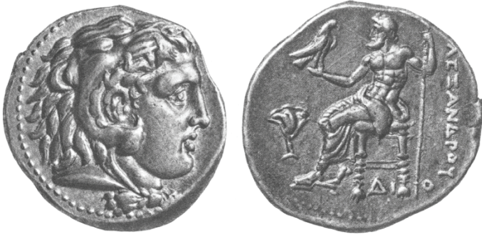
Fig. 4. Tetradracma, c. 17,19 g., Ø: 26 mm. Alejandro Magno representado con cabeza de Heracles (G. K. Jenkins, Ancient Greek Coins , London, Seaby, 1990, p. 124, 342).

Helenística que le permitía, por lo tanto, basar su acuñación en el oro. Sus acuñaciones de oro eran, en efecto, las más abundantes y las más suntuosas del mundo helenístico (por lo menos hasta al siglo II a.C.).