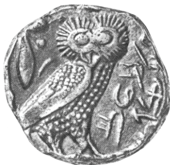
Fig. 2. Tetradracma (reverso), 15,41 g., Ø: 23 mm. Lechuza en una rama de olivo con la inscripción demótica mencionando «el faraón Artajerjes» (G. K. Jenkins, Ancient Greek Coins , London, Seaby, 1990, p. 82, 223).

Artajerjes III (343-338 a.C.) acuñó, en Menfis, tetradracmas de plata, también copiados del modelo ateniense: la cabeza de la diosa Atenea (anverso) y la lechuza de Atenas (reverso), con inscripción demótica con el nombre del rey ( Faraón Artajerjes ) - Fig. 2. Los sátrapas egipcios de Darío III Codomano (336-330 a.C.), Sabaces y, después, Mazaces, acuñaron igualmente copias de tetradracmas atenienses y en ellos inscribieron sus nombres en arameo ( Savaka y Mazdaka ). 10 Estamos, sin embargo, aún, en un estadio de acuñación y usos esporádicos de la moneda en el Egipto - Fig. 3.