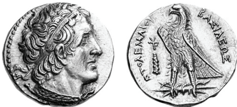
Fig. 6. Pentadracma, 17.80 g; 12h. Representación similar a la anterior, acuñada en Tiro en el reinado de Ptolomeo II (Ioannes N. Svoronos, Ta nomismata tou kratous tôn ptolemaíon , Atenas, 1904, 643).

14,25 gr. de plata. Se trató de un movimiento deliberado de alejamiento de Egipto del resto del mundo helenístico, con el objetivo de construir una autarquía económica, después consolidada políticamente, en 305 a.C., con la adopción del título de rey o basileus . Ptolomeo III Evergetes I acabaría por adoptar el peso estándar del Ática, después de cerca de 60 años de una práctica distinta. Es preciso destacar que quien determinaba el peso, la pureza del metal, los tipos y las leyendas de las monedas era la autoridad emisora.