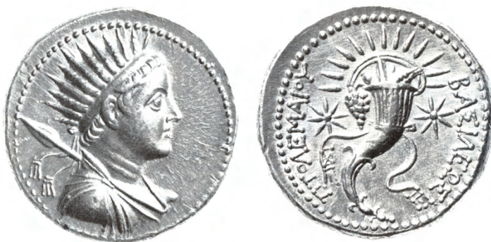
Fig. 8. Octodracma, 27,77 g., Ø: 27 mm. Anverso: Busto de Ptolomeo V con corona radiada. Reverso: cornucopia radiada, entre dos estrellas, con dos filetes colgantes y la inscripción ΠΤΟΛΕΜΑΙΟΥ ΒΑΣΙΛΕΩΣ (G. K. Jenkins, Ob. Cit. , p. 142, 384).