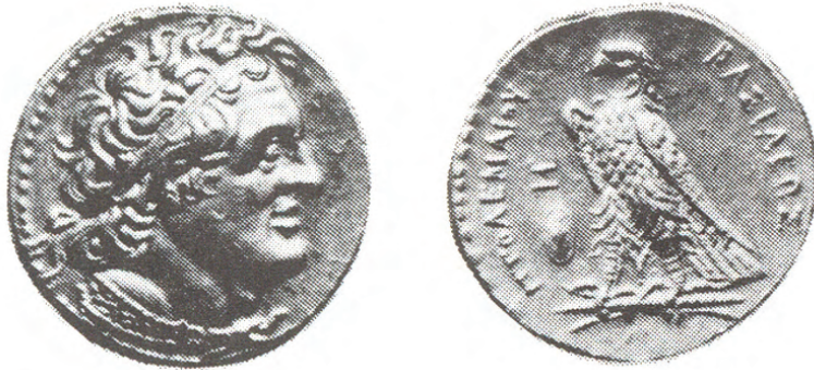
Fig. 9. Pentadracma, c. 17,8 g. Anverso: Busto de Ptolomeo I con diadema y égida. Reverso: águila de alas cerradas a la izquierda, posada sobre haz de rayos y la inscripción ΠΤΟΛΕΜΑΙΟΥ ΒΑΣΙΛΕΩΣ (David R. Sear, Greek coins and their values. Vol II. Asia and North Africa , Londres, B.T. Batsford Lda., 1979, p. 734, 769).