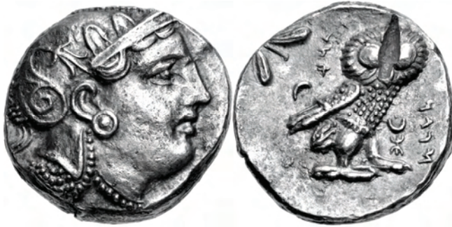
Fig. 3. Tetradracma 16.88 g, 9h Ø: 24mm. Anverso: Cabeza de la diosa Atenea de perfil. Reverso: pequeña rama y lechuza con cuerpo de perfil y cabeza de frente (Peter G. van Alfen, «The “owls” from the 1989 Syria hoard, with a review of pre-Macedonian coinage in Egypt» in American Journal of Numismatics 14, 2002, Type III, pl. 11).

La acuñación monetaria de Alejandro, abundante y regular, que, en varios locales, sustituyó a series autónomas, fue una acuñación imperial en todos los sentidos, expresión de las nuevas realidades políticas estructurales, diferente de todo lo que el mundo griego había conocido hasta entonces (primera producción masiva), tal vez sólo con la excepción de los tetradracmas atenienses de la época de Pericles, aunque desde el punto de vista artístico con una calidad inferior. 12 Sin embargo, a pesar de que los «alejandros» eran una acuñación cívica de uso internacional, no hubo ninguna tentativa de imponerlos como acuñación exclusiva.