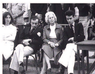
El desencanto (1976), de Jaime Chávarri

Biografias e histórias de vida Biografías y historias de vida Biographies and life stories Biographies et histoires de vie