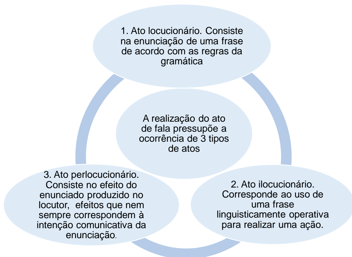
Quadro 2 (representativo dos tipos de atos de fala de Austin)

Essas ideias de Austin podem ser representadas no quadro a seguir: