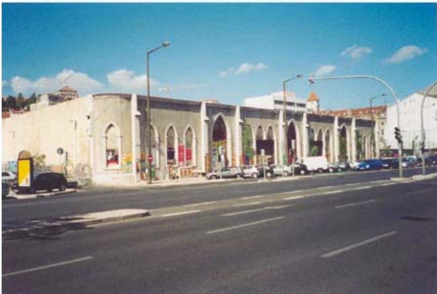
Figura 1 – A Fábrica de Gás da Boavista. Autor: Adriano Pinto Coelho, 2001

Vinham rodando ao comprido das casas, por diante da fábrica do gás . [...]” 4 [ver Fig. n.º 1]