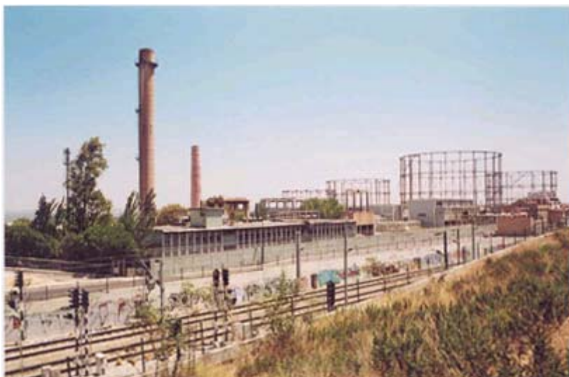
Figura 2 – Gasómetros da Fábrica de Gás da Matinha. Autor: Adriano Pinto Coelho, 2002

A propósito da história da iluminação a gás de Lisboa, pode-se, ainda, recorrer a fontes relacionadas com a segunda fábrica de gás – Fábrica de Gás de Belém, pertencente à Companhia Gás de Lisboa, a qual entrou em funcionamento em 1889 (in O Occidente ) – e com a terceira fábrica de gás – a Fábrica de Gás da Matinha, pertencente às Companhias Reunidas de Gás e Electricidade, cuja construção foi determinada por decreto em 1935 (Decreto-Lei n.º 25: 726). Da Fábrica de Gás da Matinha existem os gasómetros e algumas (poucas) estruturas que sobreviveram à sua demolição, iniciada no ano de 2002 (ver Fig. n.º 2).