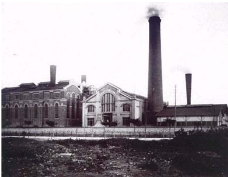
Figura 3 – Estação Eléctrica Central Tejo. Início do Século XX.

Outro exemplo de desenvolvimento do tema poderá ser uma visita de estudo à Central Tejo, actualmente Museu de Electricidade – EDP (ver Fig. n.º 3).