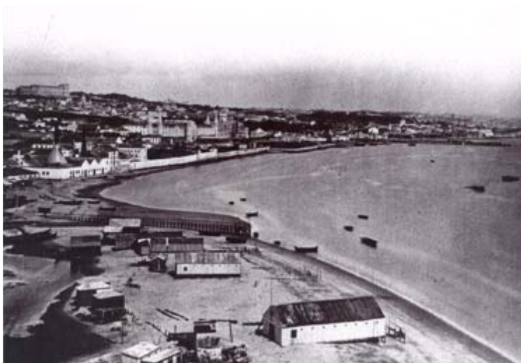
Figura 4 – Panorâmica de Belém, tirada a partir da Torre de Belém. 1881.

Assim, as fábricas que se implantaram na zona impuseram uma dinâmica de ocupação do espaço com características interessantes, como se pode observar em diversos documentos (dos quais a Fig. n.º 4 constitui um exemplo), provocando impacto no meio urbano.