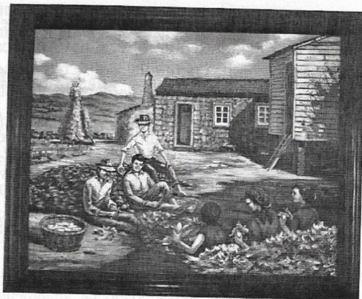
Autor: Pedro Reis