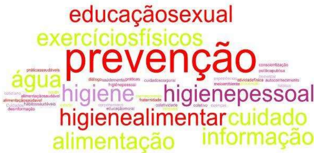
Figura 2: Associação de palavras