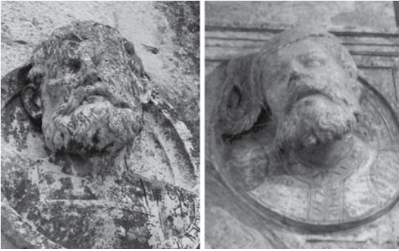
Fig. 5 Comparação entre um busto presente na arcada triunfal da Igreja do Santíssimo Milagre de Santarém e um dos bustos na Quinta da Bacalhôa.

Não tendo dados concretos sobre a campanha de obras de Azeitão patrocinadas por Brás Afonso, importa olhar para o edifício remanescente, procurando encontrar elementos que nos ajudem a situar melhor tal empreitada. Começemos pelo lado norte. A fachada da apelidada “varanda de Lisboa” apresenta bustos em médio e alto relevo, tão característicos na arquitectura coeva, tanto em exteriores, como em interiores. Já se quis identificar as personagens esculpidas,