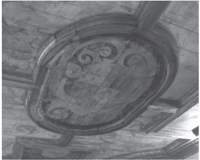
Fig. 8 Tecto da apelidada “Sala das Armas” da Quinta da Bacalhóia

O tecto está repartido em nove partes de secções variadas. Ao centro e nos extremos, como que a formar uma cruz da Ordem de Cristo, vislumbram-se cinco dessas partes, todas pintadas com escudos de armas. Nessa secção central, estão colocadas as armas dos Albuquerque (modernas), tal como surgem representadas nos azulejos da Casa de fresco ou na heráldica associada ao Vice-Rei D. Afonso de Albuquerque como nos Commentarios : escudo esquarte-