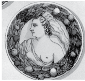
Fig. 7 Desenho publicado na obra de Joaquim Rasteiro que reproduz um dos medalhões junto da Casa de Fresco e uma gravura de 1585 de Aegidius Saedeler II.

arquitectónica (anos 40-50) e depois a ornamentação do interior (anos 50-60) com azulejos historiados e de padrão, além de pinturas sobre tela (acrescentamos nós tapeçarias), tetos de estuque ou de bordo pintados e, por último, portais e colunas de fina pedraria de jaspe que completavam com sofisticação a iconografia dos espaços.