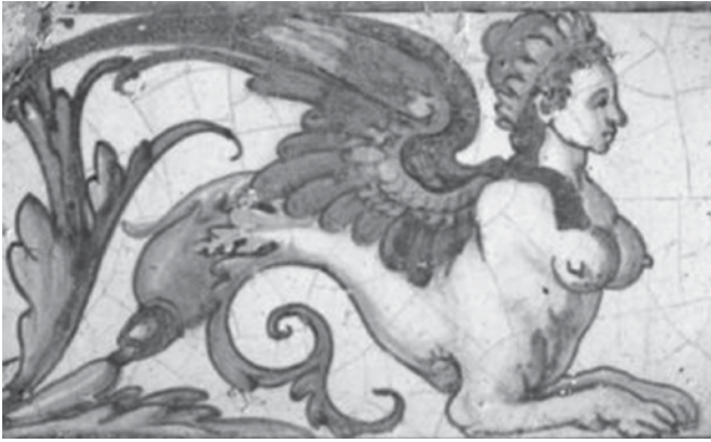
Fig. 10 Pormenor de um rodapé da Casa de Fresco da Quinta da Bacalhôa

mento c. 1562 da oficina do pintor flamengo Jan Floris (c. 1520-1567), que por coincidência estivera previamente em Portugal (c. 1555) antes de voltar para Espanha ao serviço do rei Filipe II 40 . Outros azulejos de gosto flamengo são os presentes na envolvente (p. ex. “O Rapto da Europa” (Fig. 9) segundo gravura de 1557 de Bernard Salomon ou de 1563 de Virgil Solis) e no interior da Casa de fresco, datados de 1565, inspirados em gravados de Enea Vico, datáveis de 1542, e de Cornelis Bos (Fig. 10), situáveis em torno de 1548 41 . A autoria dos azulejos da varanda e até da Casa de Fresco (que pode ter sido resultado de uma parceria) deverá contar com o nome do pintor flamengo Jan de Goes (João de Góis), que esteve entre nós, vindo de Antuérpia, pelos anos de 1553/54, dadas certas afinidades plásticas com o conjunto azulejar renascentista do Convento da Graça de Lisboa. A outra mão é seguramente um pintor de apelido “Matos” que a historiografia tem associado a Marçal de Matos, familiar do artista Francisco de Matos que firmou os azulejos da capela de S. Roque da igreja da mesma invocação em Lisboa 42 .