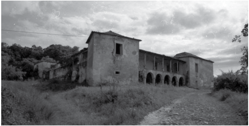
Fig. 3 Fachada nobre do palácio da Quinta do Marujal (Montemor-o-Velho)

a estruturação espacial da propriedade e a relação entre espaços, respectiva circulação e vistas, onde marcam presença também lago e jardim 20 . Em suma, utilizando o pensamento de Hélder Carita, a reorganização de todo o conjunto, agora adquirido por Brás Afonso, exprimiu-se genericamente numa “sábia e coerente articulação dos diferentes elementos arquitectónicos, pátio de entrada, corpo habitacional, jardim murado e terraços da quinta, onde observamos a aplicação de esquemas geométricos e proporcionais, baseados no quadrado e no duplo quadrado, de notória racionalidade” 21 .