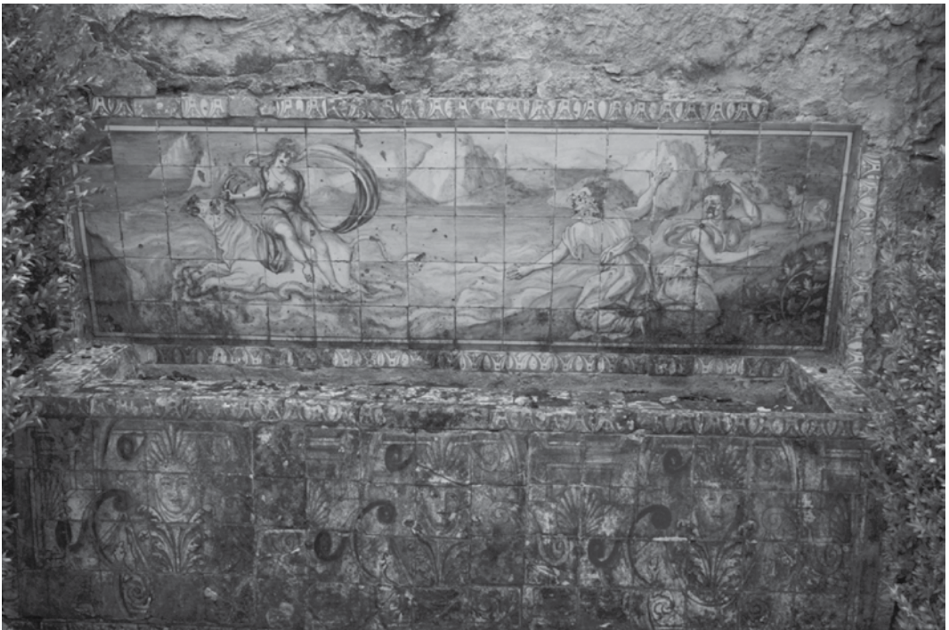
Fig. 9 “O rapto da Europa” em azulejo no jardim da Quinta da Bacalhôa

Integrada num vasto conjunto de quintas de recreio na margem sul do Tejo, mesmo defronte da capital do reino, a Quinta de Brás Afonso de Albuquerque que veio a ficar conhecida na história por Quinta da Bacalhoa, apresenta singular magnificência no contexto dos espaços exteriores e interiores das propriedades congêneres. As dimensões do terreno e a organização das construções devidamente proporcionadas, de aspecto elegante e de feição renascentista, fazem de todo o conjunto um lugar de excepção e torna-o episódio irrepetível na arquitectura de vilegiatura em Portugal. A mudança de planimetria do primitivo edifício tardo-medieval do Infante D. João e de D. Brites de Lara constituiu o principal desafio ao arquitecto responsável (Diogo de Torralva?) pela modelação da nova construção, de acordo com o cânone renascentista, bebido certamente na tratadística de Cesare Cesariano de raiz vitruviana. As obras decorreram em bom ritmo contando, com muita probabilidade, com a participação de artistas importantes no contexto cultural do tempo, dada a riqueza e o prestígio de Brás Afonso de Albuquerque. Dessa plêiade de artistas, a julgar pela obra remanescente, pressentimos a presença do escultor Diogo de Çarça, habitual colaborador de Diogo de Torralva, arquitecto plausível para a traça do novo palácio.