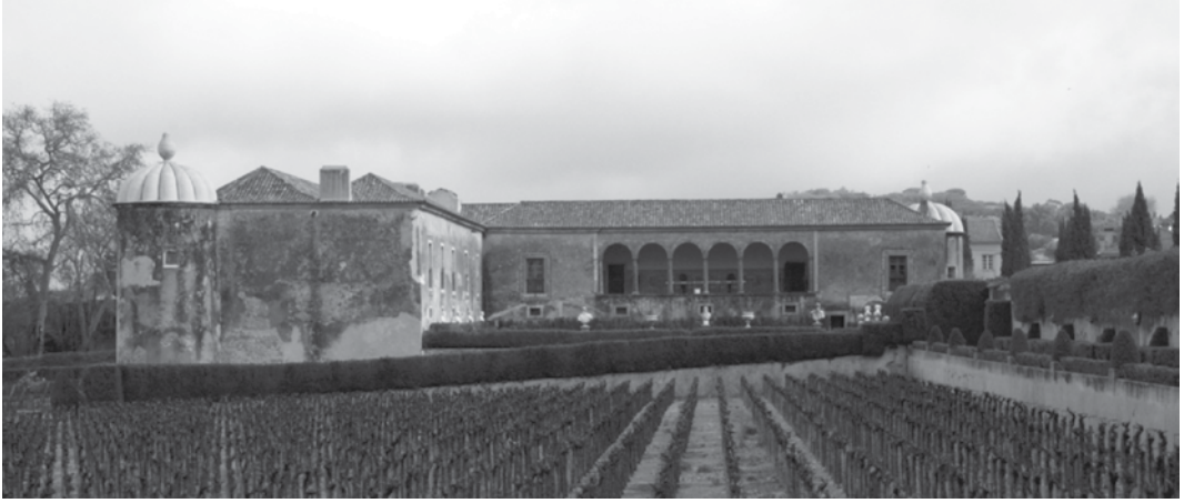
Fig. 6 Fachada poente da Quinta da Bacalhôa.

momento examinar. Sublinhe-se, por ora, que a presença da arte de Torralva em Azeitão presente-se por exemplo na concepção das escadas de caracol de Maiorca lá existentes, contemporâneas às que o arquitecto deixou na capela-mor de Santa Maria de Belém (c. 1550?), no Paço da Vila de Sintra (c. 1550-60?) ou no Convento de Cristo de Tomar (1554-1562), neste último onde existe por coincidência obra atribuível a Diogo de Çarça 27 .