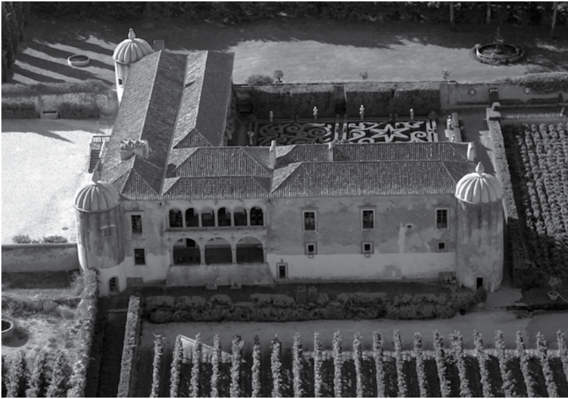
Fig. 1 Quinta de Brás Afonso de Albuquerque (Vila Fresca de Azeitão), conhecida por Quinta da Bacalhôa

tencentes ao Marquês das Minas; a ermida de Nossa Senhora das Brotas também do mesmo Marquês mas não pertencente à paróquia; a de Nossa Senhora do Cabo em Palhavã, adiante da Fonte de S. Simão; a de Nossa Senhora dos Remédios em Aldeia das Castanhas na Quinta dos Velosos.) A antiguidade da freguesia de S. Lourenço (1344) e a criação de juízo próprio e independente do de Sesimbra (1367) mostram que a comunidade era extensa e necessitava de uma divisão diocesana e administrativa devida 6 .