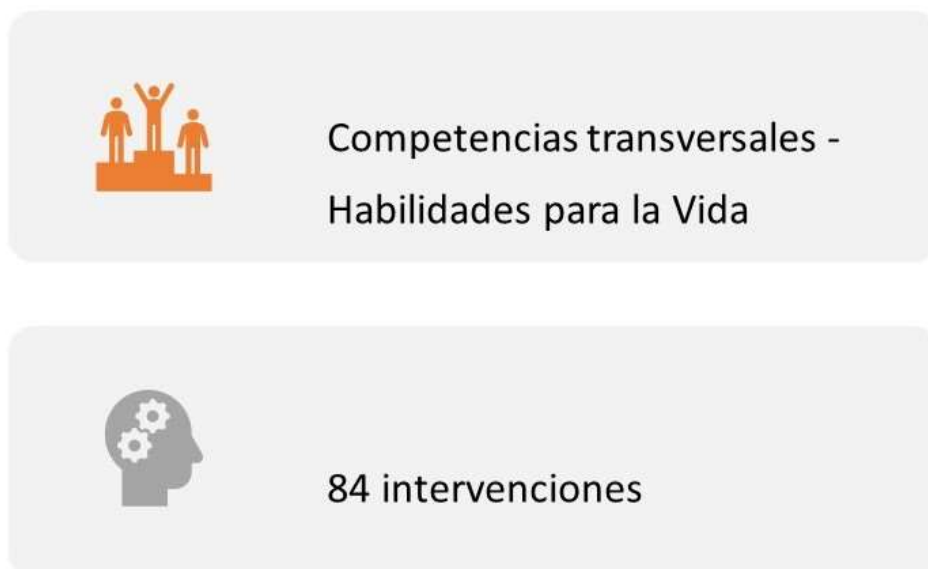
Figura 1 – Participaciones en el primer tema

El segundo tema se centró en Hábitos de Vida Saludable. En el curso del mismo se promovió el primer contacto con el programa La Aventura de la Vida, con el objetivo de facilitar el conocimiento adquirido sobre la naturaleza del programa, de tal forma que sea posible compartir esta información con otras personas. Apuntando al manejo de la metodología de trabajo que propone el programa. En relación con este tema, la propuesta tenía dos componentes: una discusión en un foro y el diseño de una actividad que pudiera incluir a las familias y otros recursos de la comunidad. La participación volvió a ser intensa (ver Figura 2), e incluso en algunos casos las propuestas de actividades se desarrollaron con el alumnado.