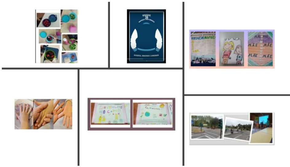
Figura 5 – Aplicación II