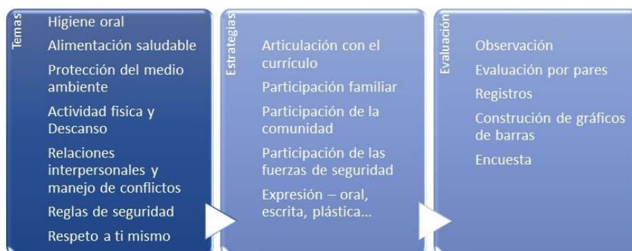
Figura 3 – Temas, Estrategias y Evaluación

Los desafíos de la aplicación fueron compartidos durante la capacitación, en el foro y en los momentos sincrónicos programados para tal fin. Los resultados fueron muy enriquecedores para todas las personas involucradas (cf. Figuras 4 y 5).