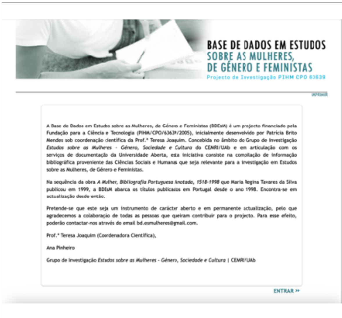
Figura: 2.1: Imagem da página de entrada na Base de Dados em Estudos sobre as Mulheres, de Género e Feministas

Na Figura 2.1 pode observar-se a página de entrada no projeto.