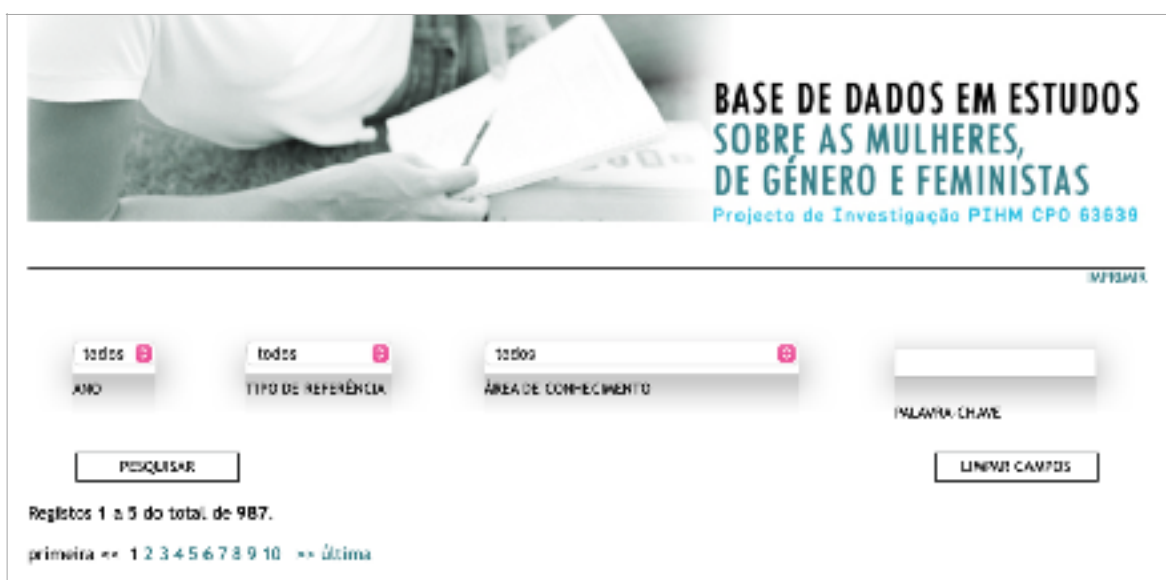
Figura: 2.2: Cabeçalho da página da Base de Dados em Estudos sobre as Mulheres, de Género e Feministas

Criada com o objetivo de facilitar a localização de publicações no campo dos Estudos sobre as Mulheres, de Género e Feministas e providenciar uma perspetiva panorâmica sobre a produção científica neste campo de conhecimento, a BDEsMGF constitui-se como uma importante ferramenta de pesquisa e como um importante suporte na construção teórica de uma problemática. Uma das primeiras tarefas a desenvolver na produção de investigação científica é, de facto, a pesquisa de títulos anteriormente produzidos e difundidos sobre o tema.