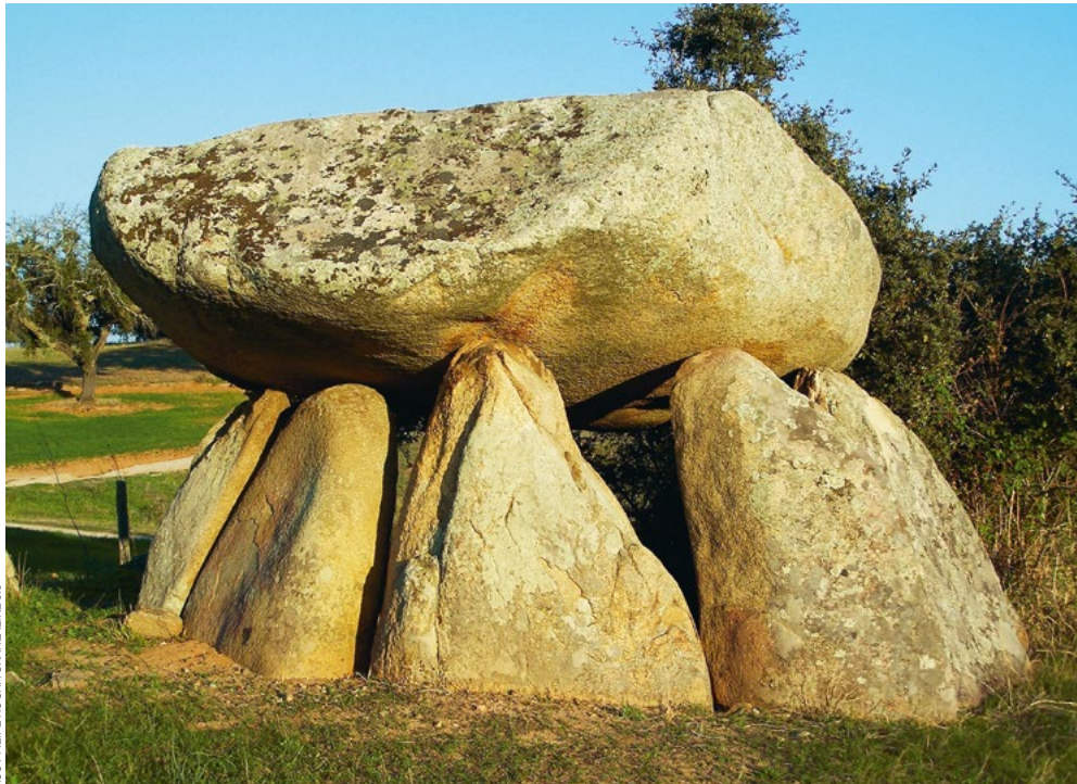
Anta Grande da herdade da Ordem (Aviz). Note-se o enorme bloco que serve de chapéu.

lações realizadas, realidade que prossegue no decurso do Neolítico Final ao longo da segunda metade do 4.º milénio conforme demonstra a necrópole coletiva do mesmo tipo da gruta do Escoural (Montemor-o-Novo). Com efeito, as datas de radiocarbono 14 obtidas sobre restos humanos ali recolhidos indicam que a utilização daquele espaço se realizou já na segunda metade do 4.º milénio a.C., coexistindo com a construção dos grandes dólmenes conhecidos na região.