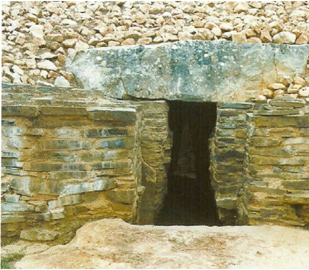
Vista exterior da entrada da sepultura de falsa cúpula de Alcalar 7 (Portimão)

jacência imediata de dois dólmenes pré-existent. Foram, aliás, estas duas evidências, que permitiam demonstrar no território português a anterioridade das construções dolmênicas face às sepulturas de falsa cúpula. Numa época em que as datações de radiocarbono 14 ainda não eram conhecidas, alguns arqueólogos de projeção internacional concluíram, erradamente, que os dólmenes de corredor do território português como grosseiras imitações das tholoi do mediterrâneo oriental, conclusão pela primeira vez posta em causa pela evidência alentejana, justamente valorizada por Georg e Vera Leisner.