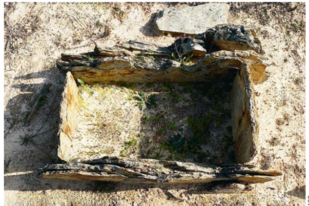
Vista de uma das sepulturas da Necrópole do Pessegueiro na atualidade.

caso da bacia lusitânica, desde a região de Santiago do Cacém ao Cabo Mondego. Com efeito, as grutas conhecidas nesta região têm evidenciado ocupações frequentes do Neolítico Médio globalmente situadas na primeira metade do 4.º milénio a.C., constituindo exemplos particularmente importantes as necrópoles então organizadas nas grutas naturais do Lugar do Canto (Alcanena) e do Algar do Bom Santo (Alenquer). Em ambos os casos, as tumulações correspondiam a simples deposições dos corpos no chão primitivo das cavidades acompanhados por oferendas de diversos tipos, desde adornos pessoais, com destaque para as braceletes de concha de Glycymeris sp., até artefactos do quotidiano representados por machados e enchós de pedra polida e instrumentos de pedra lascada, como lâminas não retocadas e micrólitos geométricos. Tais necrópoles coletivas evidenciavam ausência de segregações de cada uma das tumu-