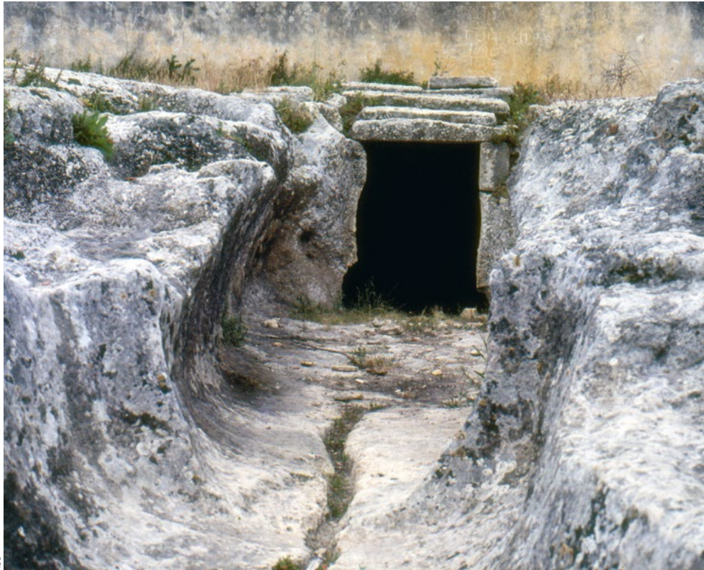
Vista da entrada da gruta artificial n.º 1 de Alapraia (Cascais). Em primeiro plano, evidencia-se o longo corredor, cuja porta de comunicação com a câmara do monumento, em segundo plano, foi modernamente transformada tendo em vista a sua reutilização doméstica.

passadas que constituíam, no seu todo, a cúpula do monumento. Estes, tal como os dólmenes, eram cobertos originalmente por montículos estruturados constituídos por pedra e por terras compactadas, que marcava visualmente a paisagem de forma impressiva ao contrário do que se verificava com as grutas artificiais.