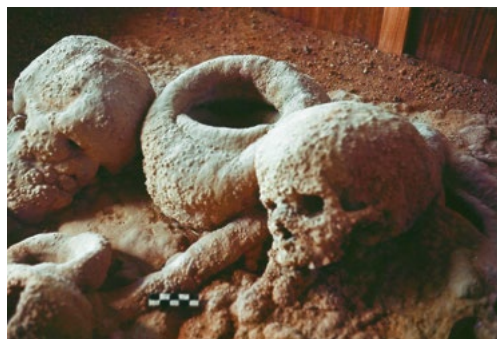
Pormenor de placa estalagmítica da gruta do Escoural (Montemor-o-Novo). Observe-se a existência de dois crânios humanos e de vasos esféricos lisos colocados ritualmente uns dentro dos outros, testemunhos da forma como se processaram as deposições funerárias e as respetivas oferendas, sobre o chão primitivo da gruta, nos inícios do Neolítico Final.

Os conjuntos mais importantes e numerosos representados pelas necrópoles da região de Lisboa integram grutas que, na sua organização arquitetónica ideal, possuem um átrio exterior, comunicando com um corredor mais ou menos longo e