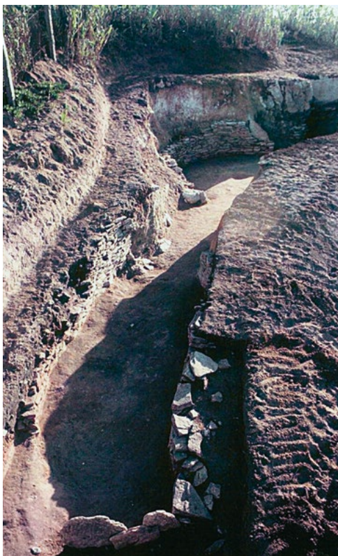
Vista do fecho da câmara da sepultura de falsa cúpula de Alcalar 7 (Portimão), antes do restauro realizado. Observe-se o progressivo fecho da abóbada da câmara e a passagem desta ao corredor, marcada pela colocação de grande lintel. Arquivo de João Luís Cardoso. Fundo de Octávio da Veiga Ferreira.