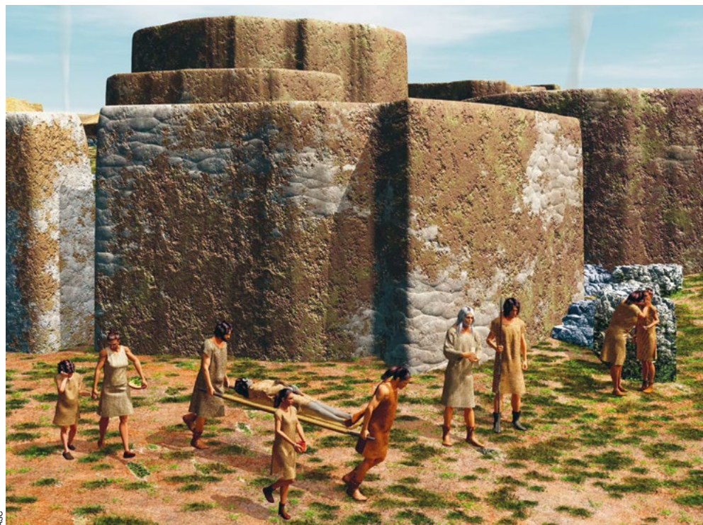
Reconstituição de um funeral de habitante do povoado pré-histórico de Leceia. Conceção e desenho digital de Bernardo Lam Ferreira / João Luís Cardoso.

De acordo com as últimas investigações realizadas no concheiro do Cabeço da Amoreira (ver capítulo neste volume) a transição para as primeiras sociedades neolíticas documentadas na mesma região ter-se-á efetuado de forma gradual, pro-