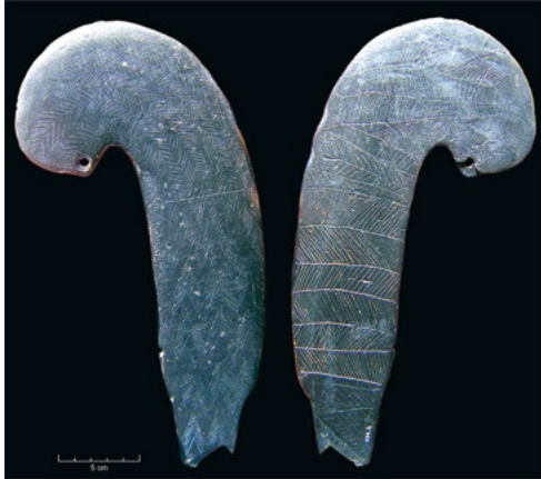
Báculo» votivo de xisto decorado em ambas as faces por motivos geométricos, proveniente do dólmen de Estria (Sintra). Museu Geológico do LNEG. Arquivo de João Luís Cardoso. Fundo de Octávio da Veiga Ferreira.