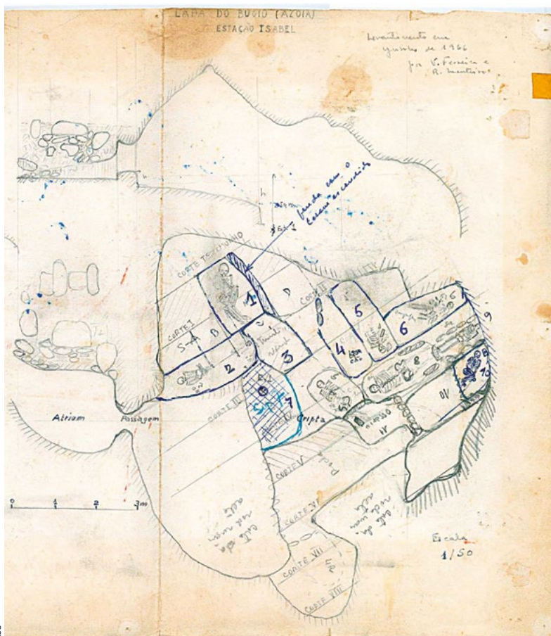
Original da planta da necrópole do Neolítico Final da Lapa do Bugio, gruta natural da região de Sesimbra. Observe-se a delimitação por muretes de cada enterramento, no seio da necrópole coletiva.

A construção das grutas artificiais poderia ter resultado, em parte, da ausência de grutas naturais nas regiões onde ocorrem, a par da indisponibilidade de grandes lajes para a construção de dólmenes, sem prejuízo de poderem revelar influências culturais mediterrâneas dada a semelhança com as ocorrências ali conhecidas, da mesma época.