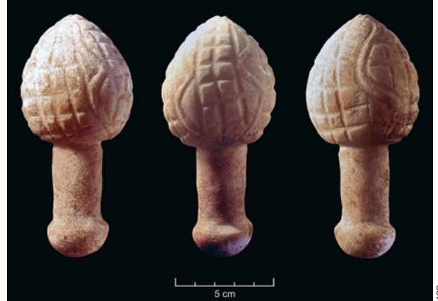
«Pinha» votiva de calcário, munida da respetiva empunhadura, do dólmen de Casaiinhos (Loures). Observe-se a representação de várias serpentes, símbolos da vida subterrânea, Museu Geológico do LNEG.