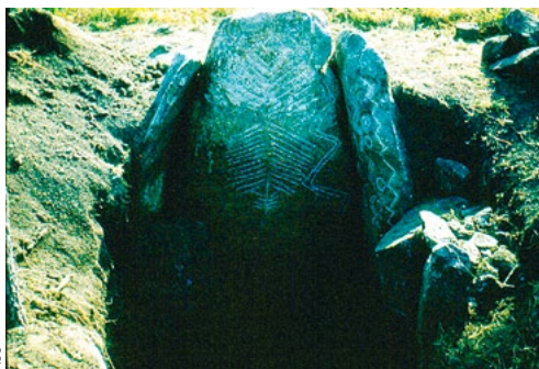
Anta 2 de Chão Redondo (Sever do Vouga) exibindo decorações insculptadas geométricas nos esteios semelhantes às observadas nos monumentos megalíticos irlandeses.

Em síntese: no Neolítico Antigo as sepulturas conhecidas no território português estão documentadas por tumulações em grutas naturais, cujas características específicas ainda se desconhecem, e por sepulturas individuais em covachos abertas no solo; a situação complexifica-se no Neolítico Médio e sobretudo no Neolítico Final, com a emergência de verdadeiras necrópoles coletivas, tanto em grutas naturais, como em dólmenes, sucedâneos das pequenas sepul-