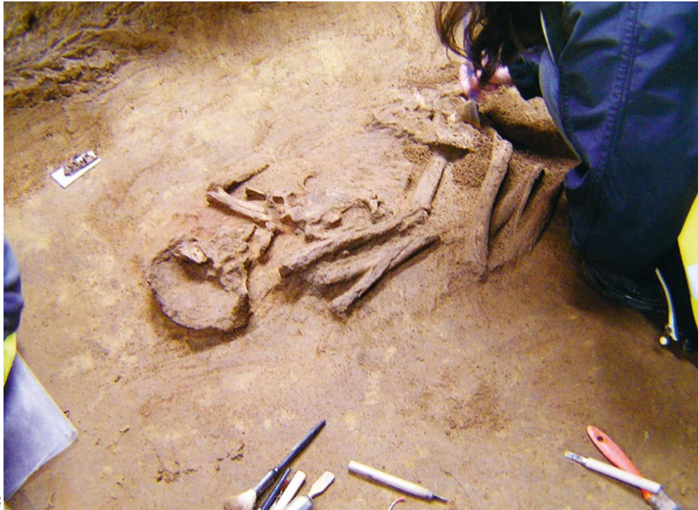
Enterramento em fossa do Neolítico Antigo identificado nas escavações realizadas no Palácio Ludovice, no Centro Histórico de Lisboa pela empresa Neoépica, Lda., em curso de escavação. Observe-se a deposição do corpo em decúbito lateral, com braços e pernas fletidos.

gere a escavação realizada no segundo daqueles sítios. Estava-se ainda na presença, por certo, de sociedade igualitária a qual, a breve trecho, iria conhecer assinaláveis diferenças estruturais.