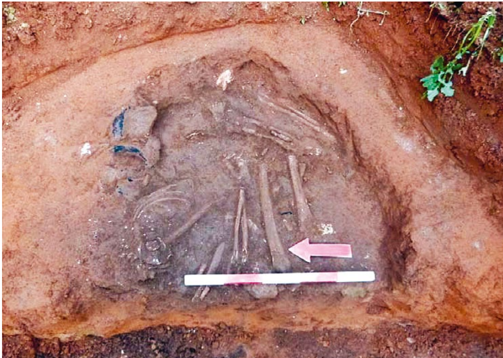
Enterramento em fossa do Neolítico Antigo identificado nas escavações realizadas nos antigos Armazéns Sommer (Lisboa). Observe-se a deposição do corpo em decúbito lateral, com braços e pernas fletidos.

vocada por estímulos externos, que propiciaram a adopção de novas tecnologias, características das primeiras sociedades produtoras de alimentos, como o fabrico de machados e enxós de pedra polida e a introdução do fabrico da cerâmica. Estava-se então no Neolítico Antigo, na segunda metade do 6.º milénio a.C. A esta época pertencem as tumulações neolíticas realizadas em algumas grutas no Maciço Calcário Estremenho e zonas limítrofes como é o caso da Gruta do Caldeirão (Tomar), aliás na tradição das que, na mesma região se teriam realizado no Paleolítico Superior. Pode assim concluir-se que, enquanto no vale do Tejo, continuava-se a viver um quotidiano de pura caça e recolção, na região a Ocidente, entre o Oceano e o Tejo, já existiam populações neolitizadas.