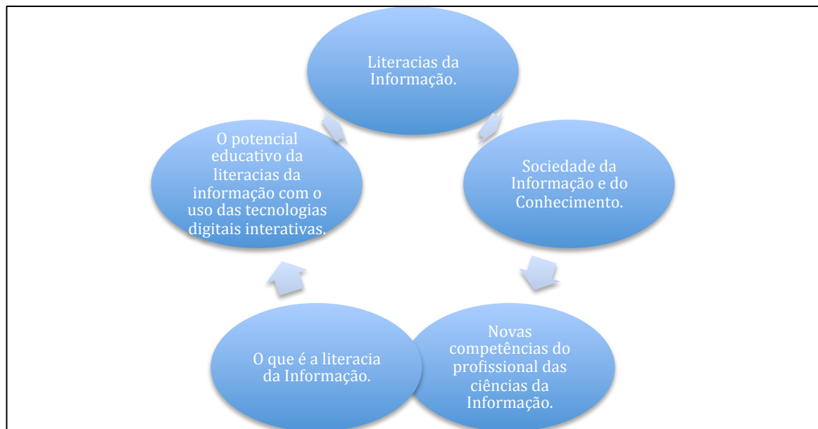
Figura 1: Relação entre os temas desenvolvidos na Unidade Curricular de Literacias da Informação do curso de pós-graduação.

Os temas foram organizados a partir de textos que fundamentam a área em que o estudante pudesse conhecer ou para aqueles que já conheciam o tema em questão ou já haviam estudados algo, pudessem aprofundar o seus referencias e reflexão sobre o tema para compreender os elementos e características que facilitaram o desenvolvimento da literacia da informação no contexto atual.