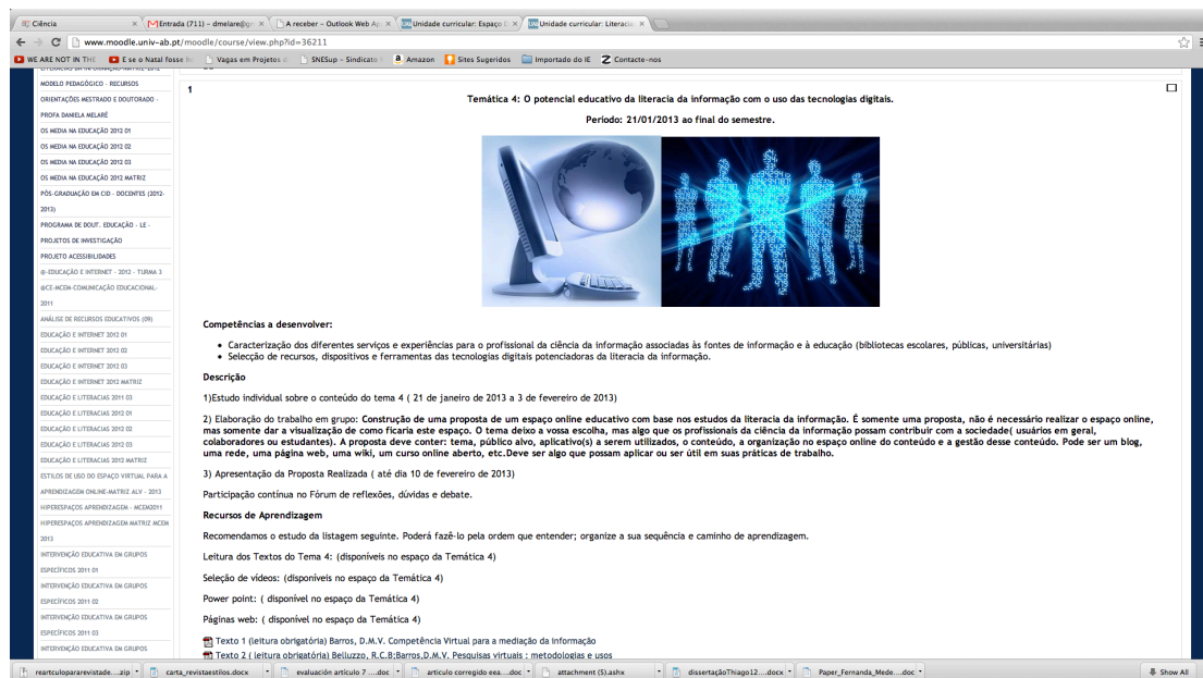
Figura 02: Imagem da Unidade Curricular Literacias da informação

Este cenário do estudo, nos conduziu para algumas reflexões que auxiliaram no desenvolvimento de estratégias sobre o desafio dos estudantes em experienciar a literacia da informação como potencial educativo.