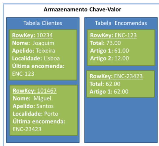
Figura 1 - Estrutura de armazenamento Chave-Valor

As soluções Chave/Valor ( Key/Value ) [Shinde 2013] podem-se representar como um hashmap ou array associativo. Estas têm as estruturas mais simples das soluções NoSQL e garantem a consulta da informação pela chave de forma muito eficiente, em média uma complexidade algorítmica de \Theta(1) . O valor não tem qualquer estrutura pré-definida, figura 1.