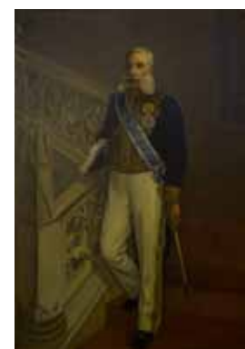
Duque de Palmela D. António de Sampaio e Pina de Brederode (17.10.1890 a 5.11.1905)